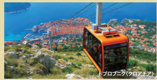
ドブロブニク(クロアチア)

ギリシャの島々を巡るエーゲ海はクルーズの定番エリアです。クロアチアの海岸線を巡るアドリア海は近年人気。イタリアのベニスやアテネが起点に憧れのエーゲ海をクルーズ。