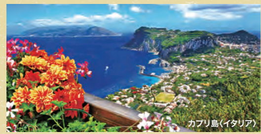
カプリ島(イタリア)

歴史や文化・グルメなど、トータルに楽しめる人気のエリア。コースは1週間～2週間程度。イタリアのシチリア島やフランスのコルシカ島、モナコなど、コースも多彩。