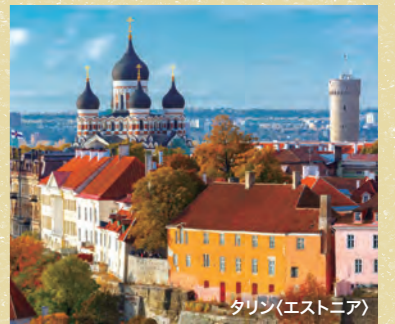
タリン(エストニア)