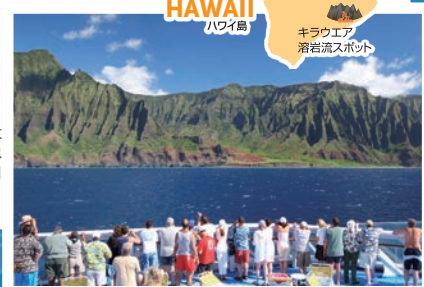
ナバリコースト(カウアイ島)

クルーズ中に、「ジュラシックパーク」「南太平洋」などの映画の舞台となり大自然の息吹を感じることが出来る「ナバリコースト」を船上からご覧頂きます。