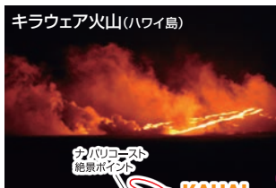
キラウエア火山(ハワイ島)

ヒロからは、キラウエア火山、マウナロア火山という2つのハワイ火山国立公園を訪れることができます。