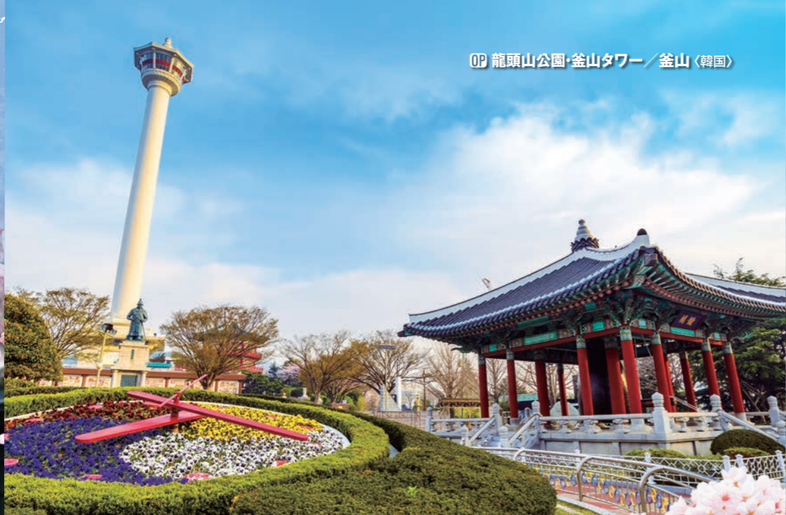
OP 龍頭山公園・釜山タワー / 釜山 (韓国)