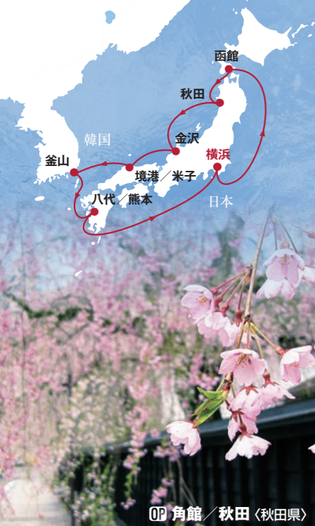
OP 角館 / 秋田 (秋田県)