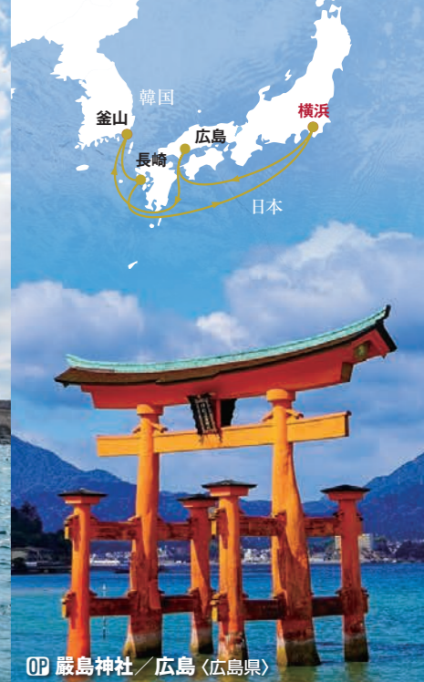
OP 厳島神社 / 広島 (広島県)