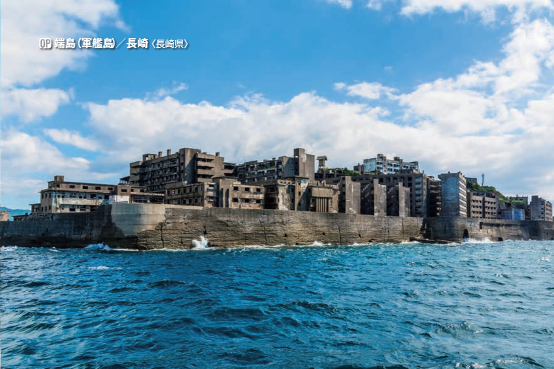
OP 端島 (軍艦島) / 長崎 (長崎県)