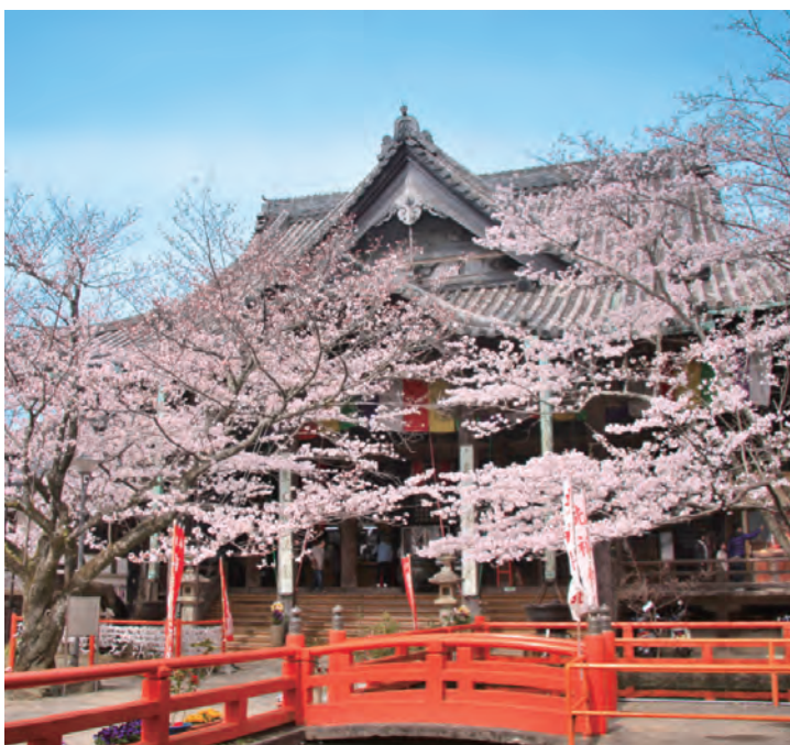
紀三井寺(日本さくら名所100選) OP 関西で一番早く開花するといわれる、紀州の桜の名所。開花宣言の目安となる和歌山地方気象台指定の標本木(ソメイヨシノ)が本堂前にあります。