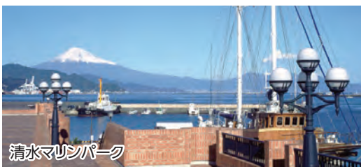
清水マリンパーク