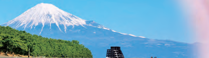
三保の松原と 富士山