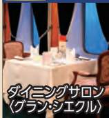
ダイニングサロン (クラシックスタイル)