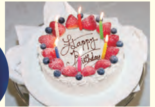
パティシエ特製 バースデーケーキ