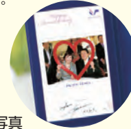
記念写真 (特製フォトフレーム付)