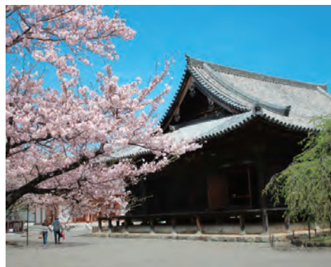
道成寺 OP 和歌山県に現存する最古の寺。能や歌舞伎で有名な「安珍清姫伝説」の舞台として知られています。裏山から境内にかけて桜が咲き誇り、本堂横にある入相桜が有名です。