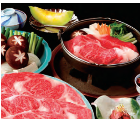
和田金での昼食(イメージ) OP