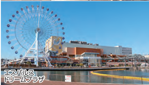
エスパルスドリームプラザ

清水すし横丁、駿河みやげ横丁、大型生鮮食品店、他にも個性豊かな店舗が集結する複合商業施設です。