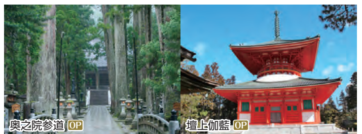
高野山 標高800m紀伊山地に開けた仏教都市。弘法大師・空海が平安時代にひらいた真言密教の修行の場です。ツアーでは空海の御廟がある聖地の中の聖地・奥之院も訪れます。