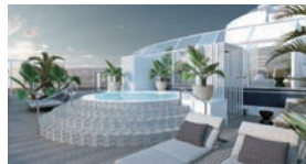
スイート客室専用のオープンデッキ「ザリトリート」を新設。