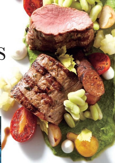
ミシュランの三ツ星で腕をふるったシェフ、コーネリアス・ギャラガーが監修する美食の数々。