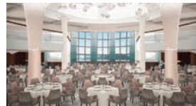
白を基調としたエレガントなメインダイニングでフルコースを。