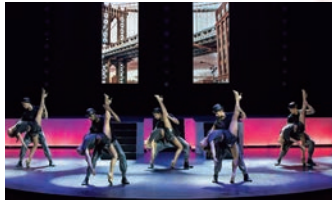
大型シアターで鑑賞する、珠玉のエンターテインメント。