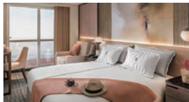
客室のデザインを一新。よりスタイリッシュな空間に生まれ変わりました。