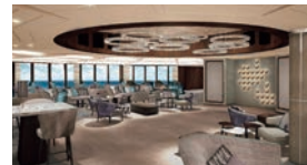
バーやラウンジも華麗に变身。くつろぎのひとつをお過ごしください。