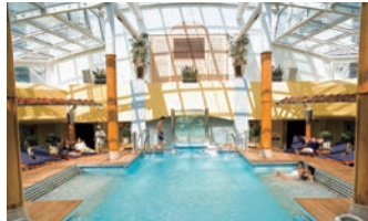
海水を使ったプール&ジャグジーはタラソテラピー効果抜群。