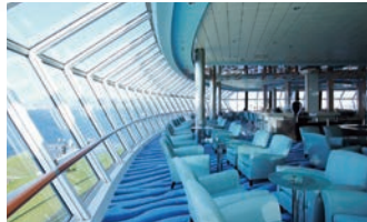
著名な建築家達が手がけたスタイリッシュな空間デザイン。