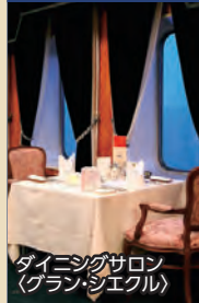
ダイニングサロン (グラン・シエルク)