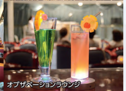
オブザベーションラウンジ