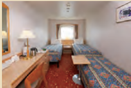
▲3名利用(ソファベッド使用例)

ステートルーム E・F・G・H・J 定員 E:2名 F~J:2~3名(15.3㎡ シャワートイレ付) ※H・Jは丸窓 E:9階 F:8階 G:6階 H:6・5階 J:5階