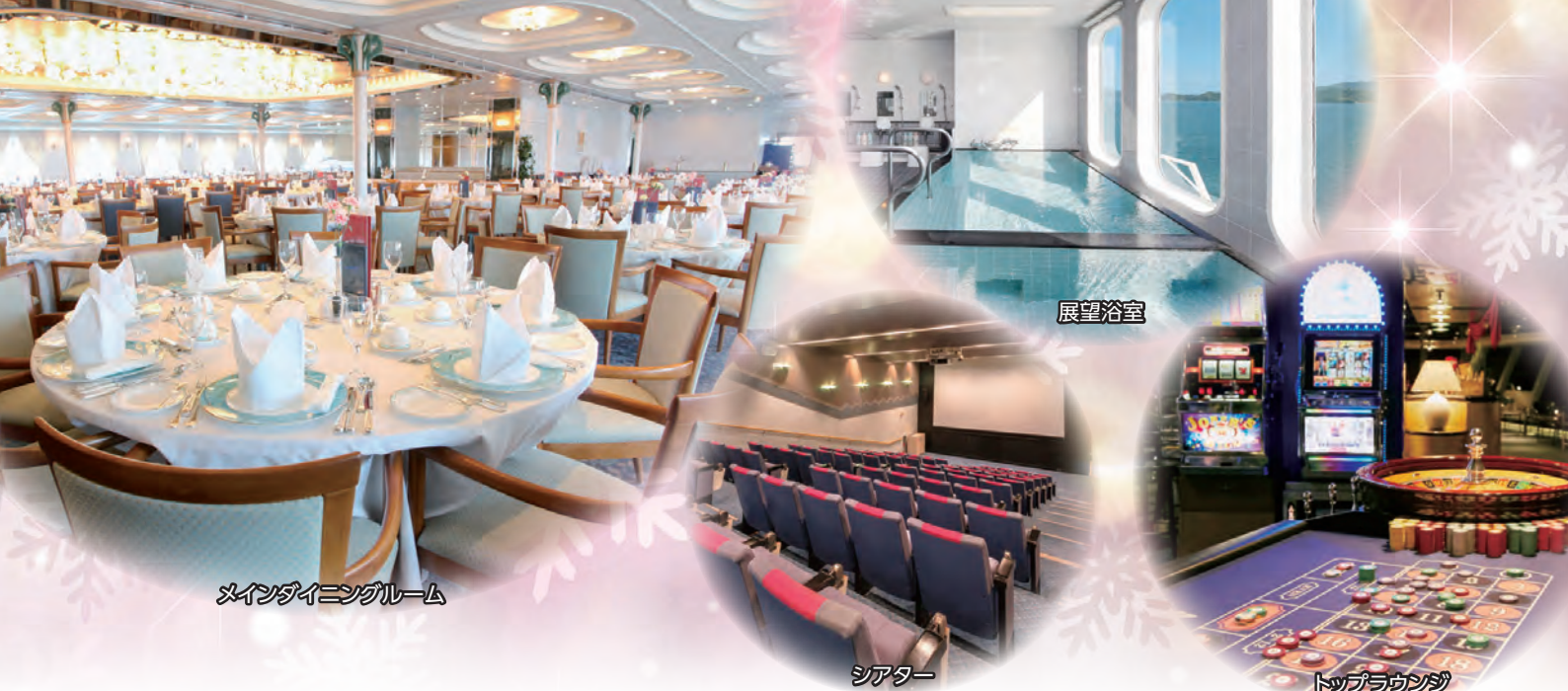
メインダイニングルーム