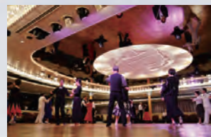
社交ダンスタイム