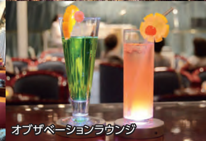
オブゼベーションラウンジ