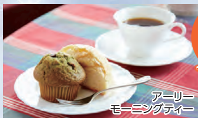
アーリー モーニングティー