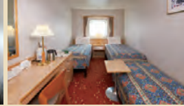
▲3名利用(ソファベッド使用例)