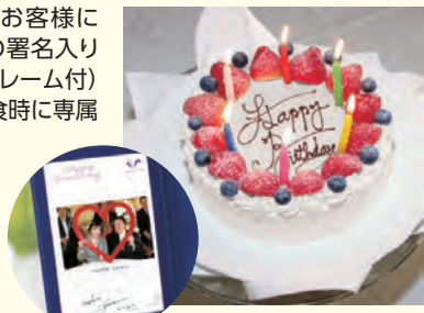
記念写真 (特製フォトフレーム付)