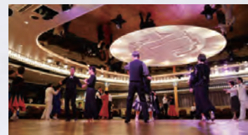
社交ダンスタイム