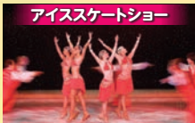
アイススケートショー プロスケーターによる迫力あるスケートショーがご覧いただけます。