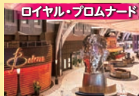
ロイヤル・プロムナード 免税店やカフェ、バーなどが軒を連ねる自慢の通り。パレードも人気。

22万7千トンという広大な船内には、それぞれ雰囲気が異なる楽しさを詰め込んだ「7つの街並み」が出現。ウォータースライダーも登場し、空まで吹き抜ける遊歩道「ボードウォーク」、緑あふれる公園「セントラル・パーク」、噴水ショーが観られる「アクアシアター」など驚きの施設が満載です。