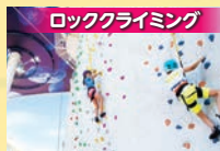
ロッククライミング インストラクターがサポートするので、初心者でも安心。