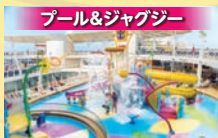
プール&ジャグジー 大きなプールやのんびりくつろげるジャグジー。スライダーも登場。