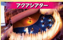
アクアシアター 迫力満点の飛び込みや噴水によるショーを上演する円形劇場。