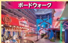
ボードウォーク 遊園地と同じ規模の回転木馬のある遊歩道。