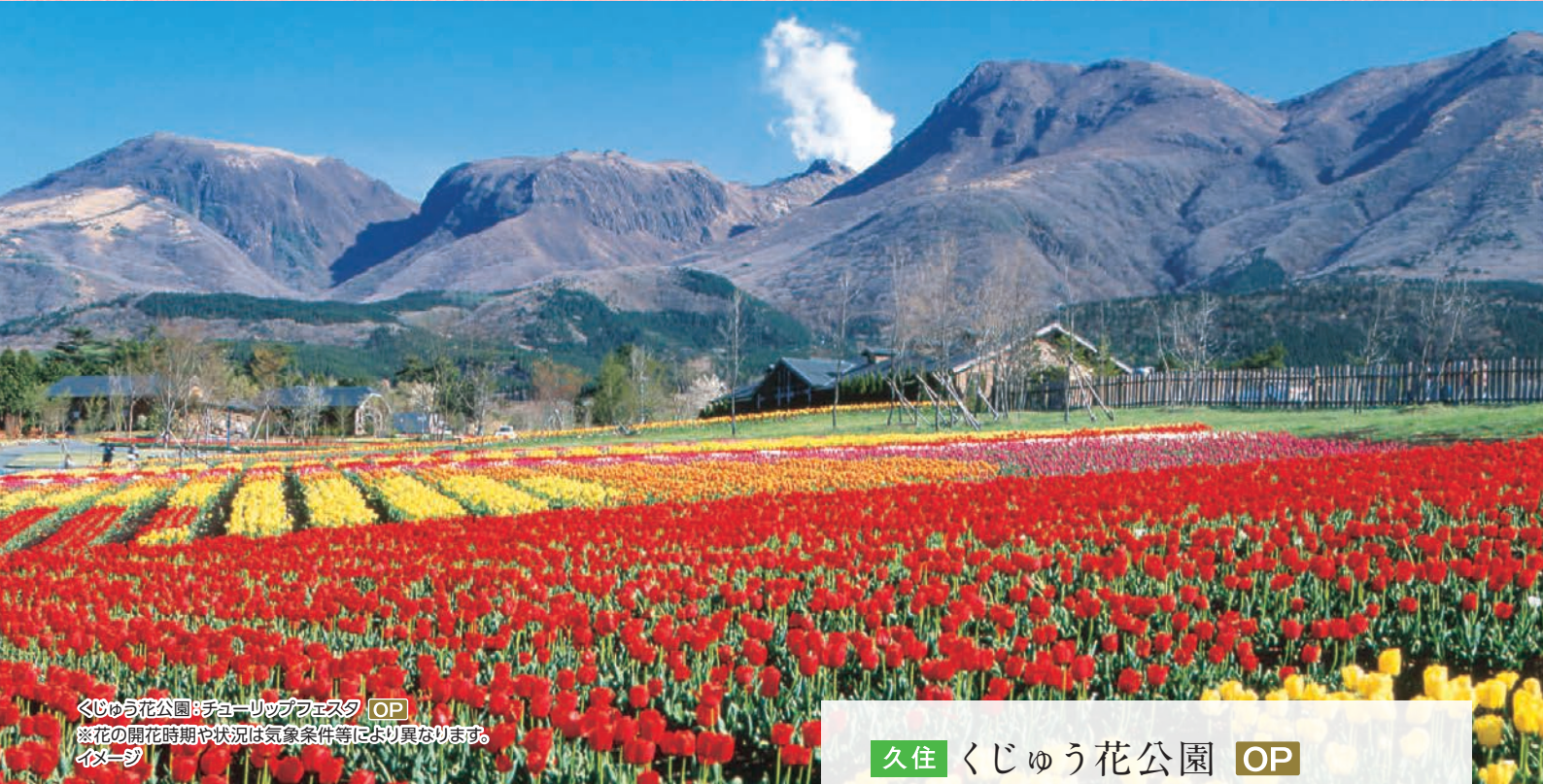
くじゅう花公園:チューリップフェスタ OP ※花の開花時期や状況は気象条件等により異なります。 イメージ