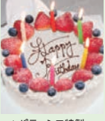
▲パティシエ特製パースデーケーキ

クルーズ中に誕生日をお迎えのお客様にはパティシエ特製パースデーケーキと記念写真を、ハネムーンや結婚記念日、金婚式(50周年)、エメラルド婚式(55周年)、ダイヤモンド婚式(60周年)、プラチナ婚式(75周年)の結婚記念の年にご夫婦でご乗船のお客様には記念写真(船長の署名入りカード・特製フォトフレーム付)をプレゼント。ご夕食時に専属バンドの生演奏で特別な日に華を添えます。 ※クルーズお申し込み時に旅行会社にお申し出ください。