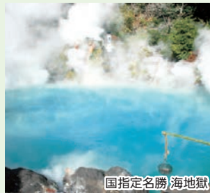
国指定名勝 海地獄

今から1,300年ほど前の鶴見岳の爆発によって誕生した広大な池で、別府地獄の中でも最大の広さを誇ります。美しいコバルトブルーの色合いは一見涼しげに見えますが、摂氏98度ととても熱くゆで卵も作れるほど！噴気で蒸した卵や地獄蒸し焼きプリンが名物として人気です。