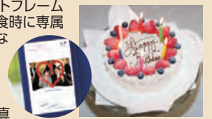
記念写真 (特製フォトフレーム付) パティシエ特製パースデーケーキ

クルーズ中に誕生日をお迎えのお客様にはパティシエ特製パースデーケーキと記念写真を、ハネムーンや結婚記念日、金婚式(50周年)、エメラルド婚式(55周年)、ダイヤモンド婚式(60周年)、プラチナ婚式(75周年)の結婚記念の年にご夫婦でご乗船のお客様には記念写真(船長の署名入りカード・特製フォトフレーム付)をプレゼント。ご夕食時に専属バンドの生演奏で特別な日に華を添えます。 ※クルーズお申し込み時に旅行会社にお申し出ください。