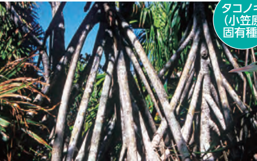
タコノキ (小笠原固有種)

小笠原の森林は固有植物や動物たちの宝庫です。島には天然記念物や絶滅危惧種などが多く生息しており、本来の自然の姿を保つためにも自主ルールやガイドラインが定められています。また、海にはクジラやイルカ、海鳥などが生息しています。運がよければ野生動物に出会えるかも。