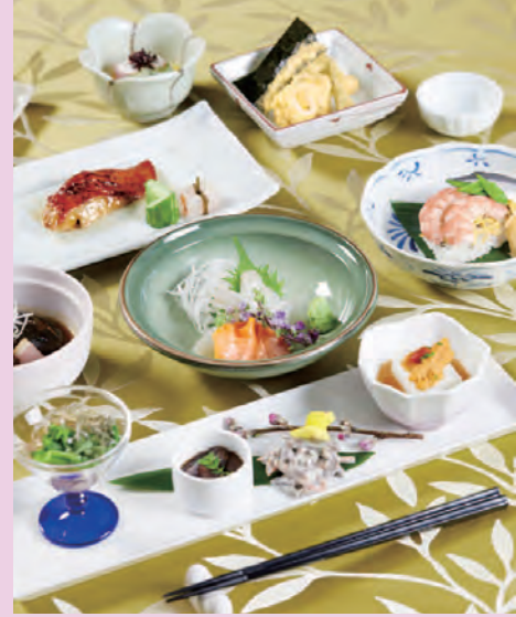
写真はすべてイメージです