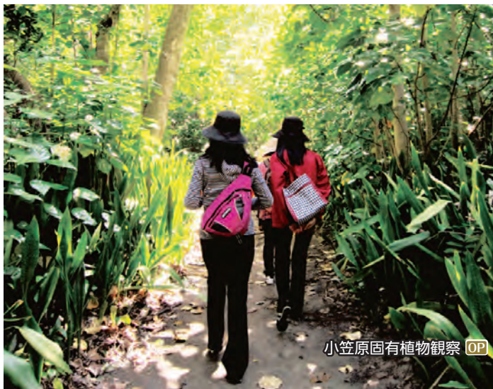
小笠原固有植物観察