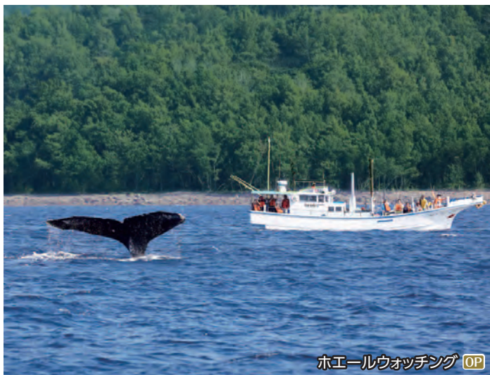
ホエールウォッチング