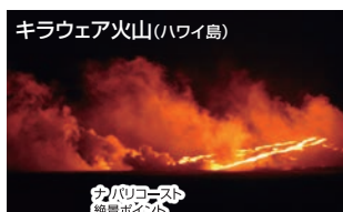
キラウエア火山(ハワイ島)

ヒロからは、キラウエア火山、マウナロア火山という2つのハワイ火山国立公園を訪れることができます。