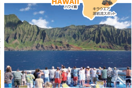
ナパリコースト(カウアイ島)

ナパリコースト ▶ クルーズ中に、「ジュラシックパーク」[南太平洋]などの映画の舞台となり大自然の息吹を感じることが出来る「ナパリコースト」を船上からご覧頂きます。