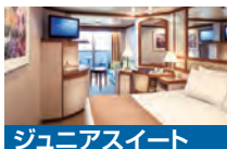
ジュニアスイート