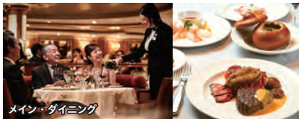
メイン・ダイニング

ダイヤモンド・プリンセスでは、本格的な高級料理からカジュアルな軽食まで多彩なバリエーションのお食事をご用意。