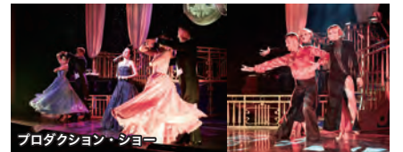
プロダクション・ショー

カジノやバー、パーティーなど華やかなナイトライフやエンターテインメントは、外国客船ならではの、日常とは違ったスペシャルな時間をお楽しみください。