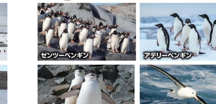
ゼンツーペンギン アデリーペンギン