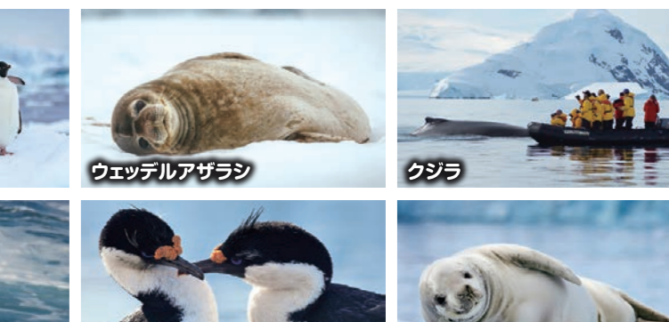
ウエッデルアザラシ クジラ