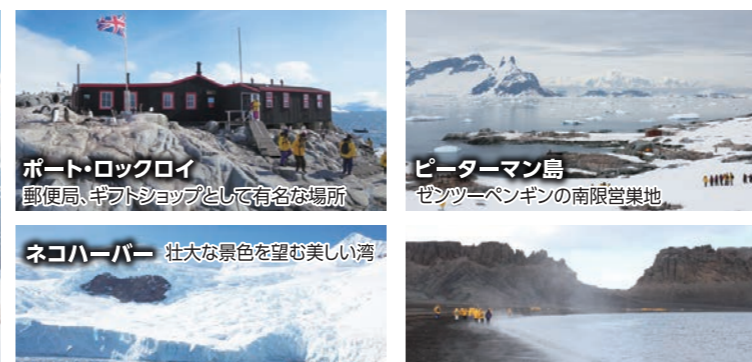
ポート・ロックロイ 郵便局、ギフトショップとして有名な場所