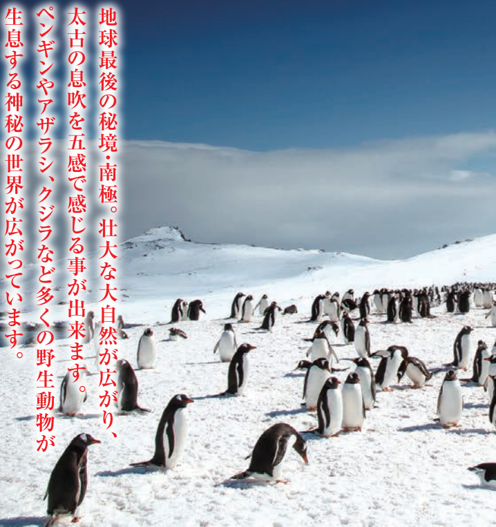
ゼンツーペンギンの営巣地