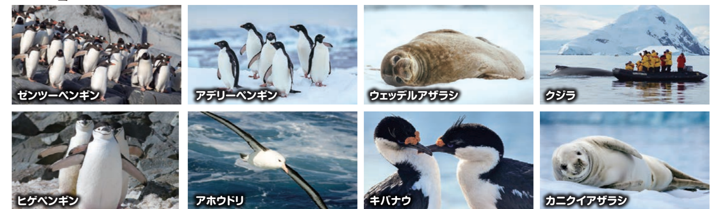
ゼンツーペンギン アデリーペンギン ウェッデルアザラシ クジラ ヒゲペンギン キバナウ アホウドリ カニクイアザラシ