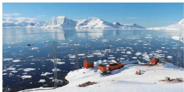
パラダイス湾 小高い丘からの素晴らしい景色をご覧頂けます

※見どころは一例です。一度の航海ですべてを訪れるわけではありません。南極の自然環境の下で訪問地が変更になる場合があります。予めご了承ください。