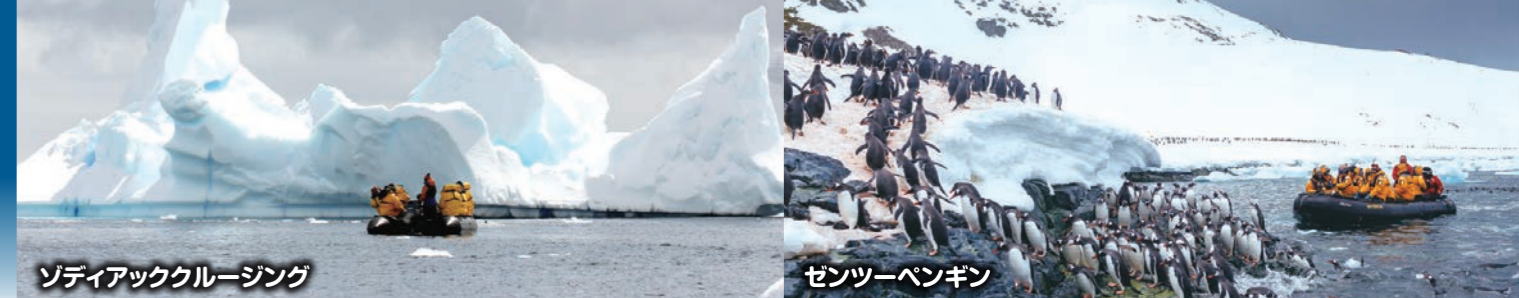
ゾディアッククルージング