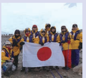
冬バナー-南極大陸上陸