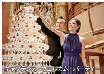
キャプテンズ・ウェルカム・パーティー

船内にはプールやジャグジーがあります。日光浴を楽しんだり、のんびりおくつろぎいただけます。