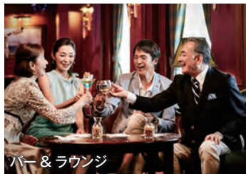
バー & ラウンジ

バンドの生演奏、スポーツ観戦、ダンスタイムなど様々なパーティー、イベントが行われます。