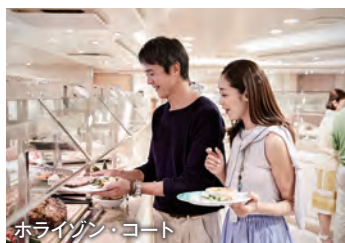
ホライズン・コート

ブッフスタイルで朝・昼・夜、ティータイムや夜食にもご利用いただける無料のレストラン。