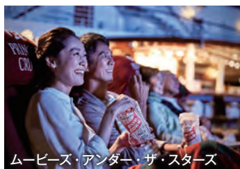
ムービーズ・アンダー・ザ・スターズ

ブッフスタイルで朝・昼・夜、ティータイムや夜食にもご利用いただける無料のレストラン。