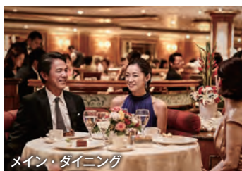
メイン・ダイニング