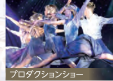
プロダクションショー

旬の食材をいかしたフレンチのコース料理をはじめ、クルーズのあらゆるシーンを彩るバリエーション豊かなメニューをご用意しています。