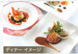
ディナー イメージ

美食やエンターテイメント、充実の施設と上質なおもてなしで、飛鳥IIならではの洋上ライフを。