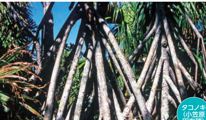
タコノキ (小笠原固有種)