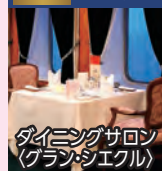
ダイニングサロン (グラス・エクル)

◆専用ダイニングで専属シェフによる特別なメニューときめ細やかなサービスでおもてなし。二人掛けテーブルでゆったりとお食事をお楽しみいただけます。 ◆ダイニングサロンは未就学児童の方はご利用いただけません。 ◆乗船日にはお部屋にウェルカムスイーツをお届けします。