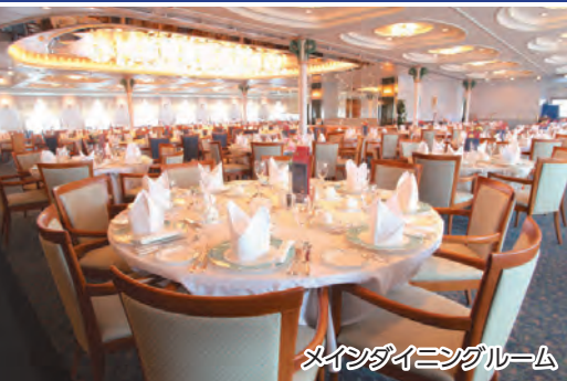
メインダイニングルーム