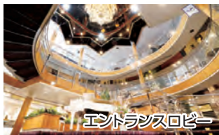
エントランスロビー