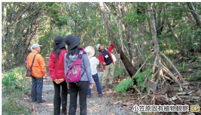
小笠原固有植物観察 OP