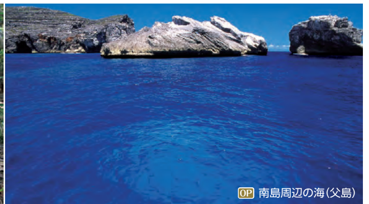
OP 南島周辺の海(父島)