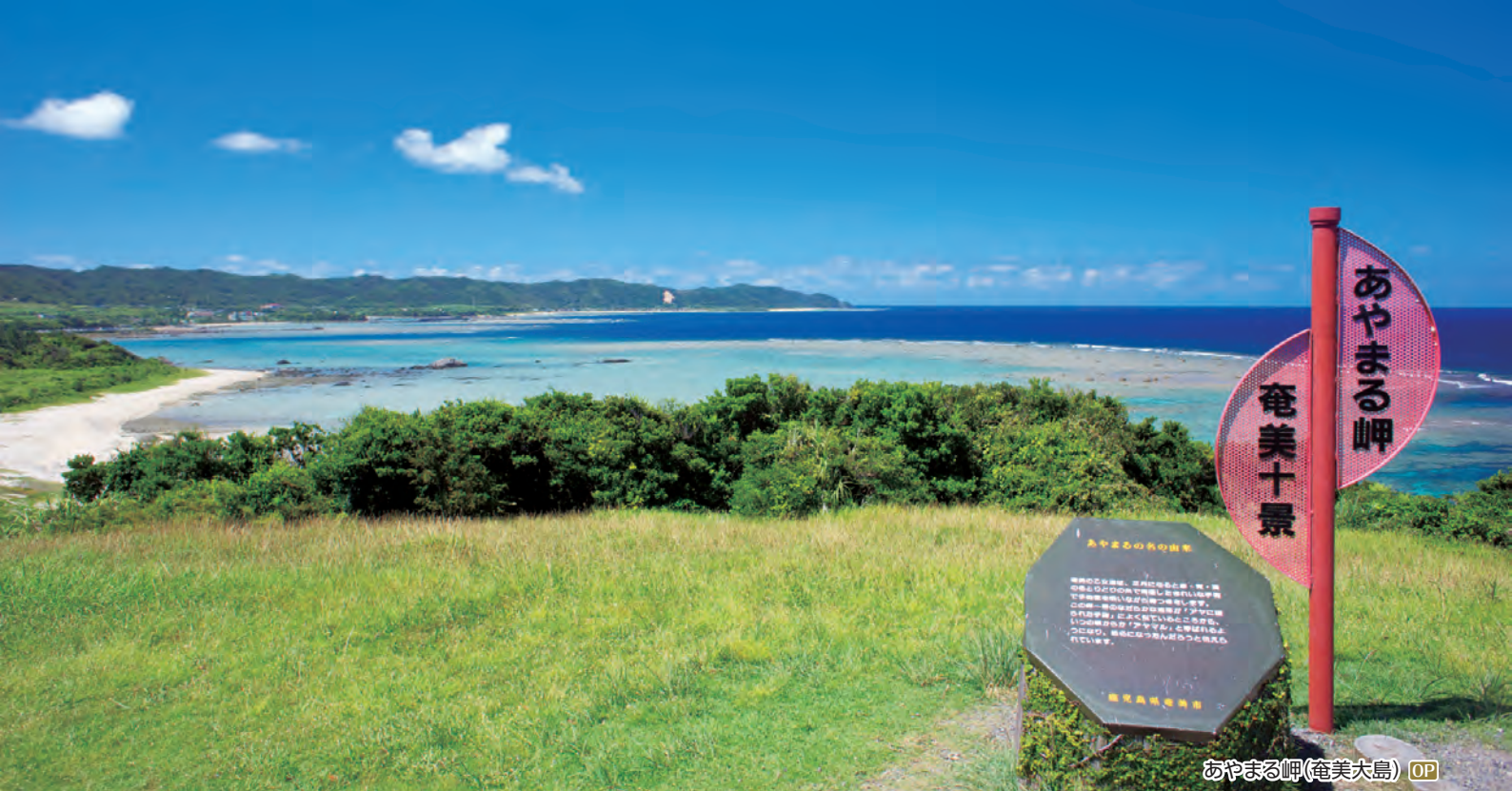
あやまる岬(奄美大島) OP