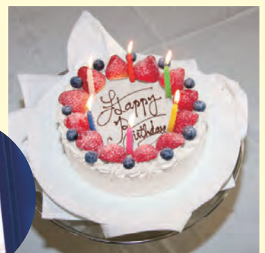
パティシエ特製バースデーケーキ