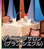
ダイニングサロン (グランシェイクル)

◆専用ダイニングで専属シェフによる特別なメニューときめ細やかなサービスでおもてなし。二人掛けテーブルでゆったりとお食事をお楽しみいただけます。 ※ダイニングサロンは未就学児童の方はご利用いただけません。 ◆乗船日にはお部屋にウェルカムスイーツをお届けします。