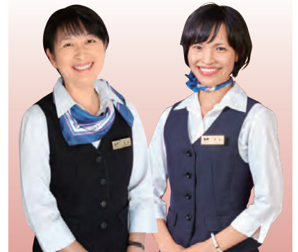
クルーズコーディネーター

船内生活のご相談は 船内7階クルーズデスクへ。 皆様の旅をお手伝い いたします。