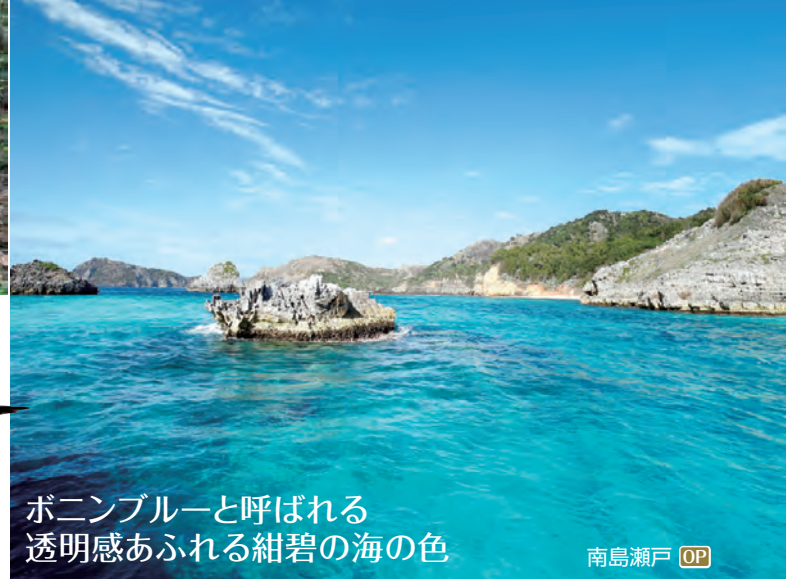
ボニンブルーと呼ばれる 透明感あふれる紺碧の海の色