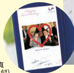
記念写真 (特製フォトフレーム付)