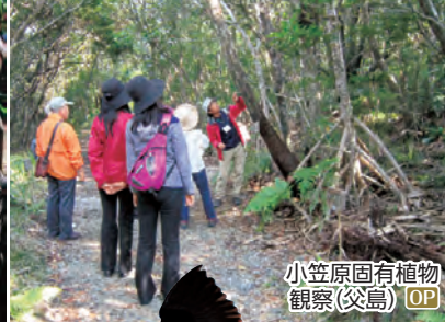
小笠原固有植物 観察(父島) OP