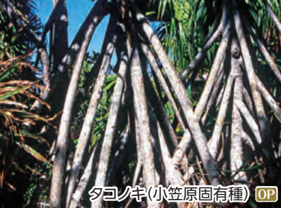
タコノキ(小笠原固有種) OP