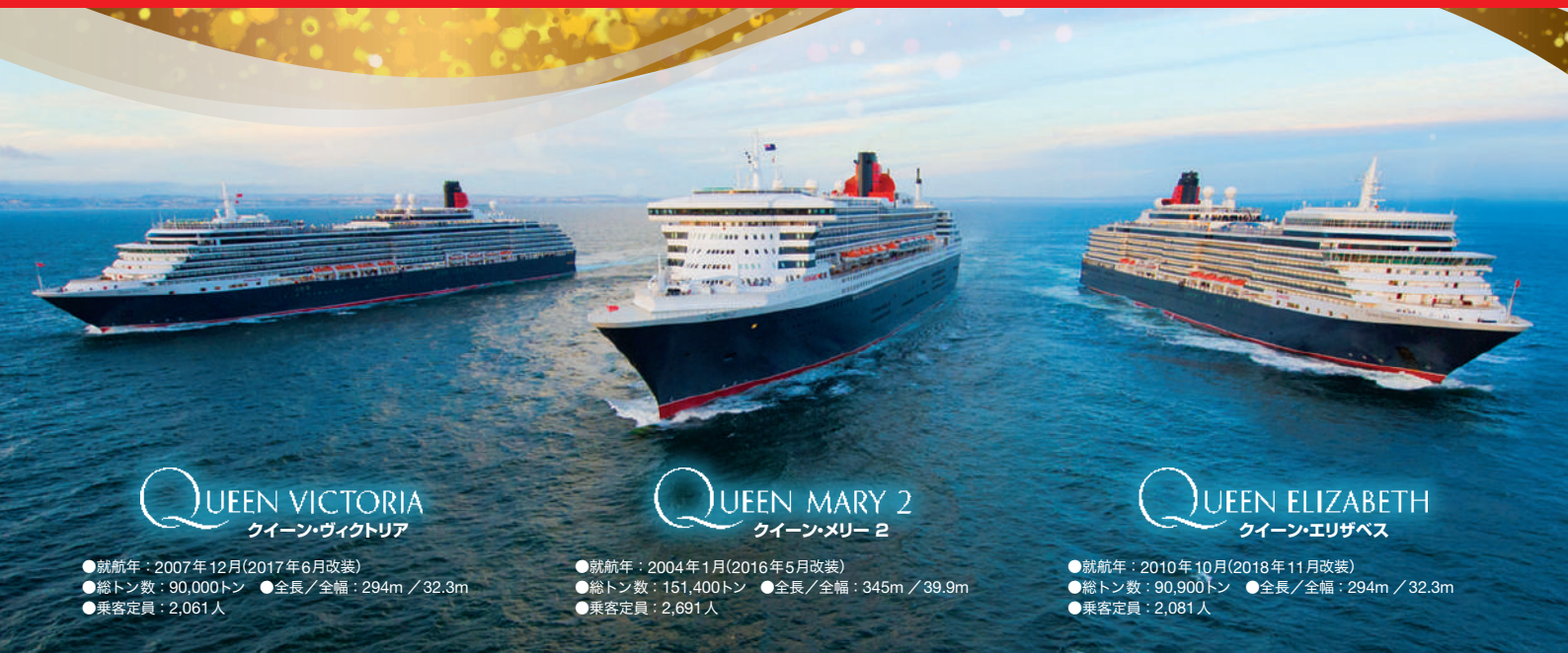
QUEEN VICTORIA クイーン・ヴィクトリア