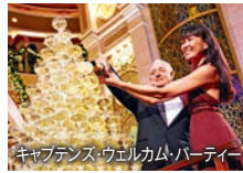
キャプテン・ウェルカム・パーティー