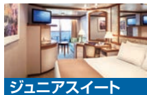
ジュニアスイート