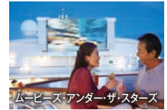
ムービー・アンダー・ザ・スターズ