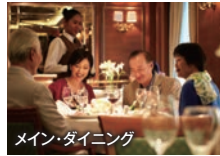
メイン・ダイニング