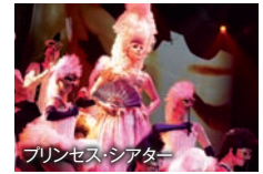
プリンセス・シアター