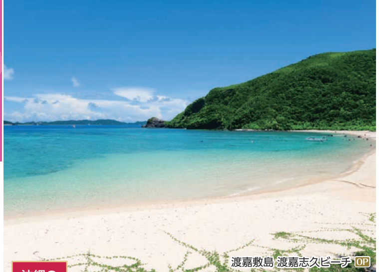
渡嘉敷島 渡嘉志久ビーチ OP