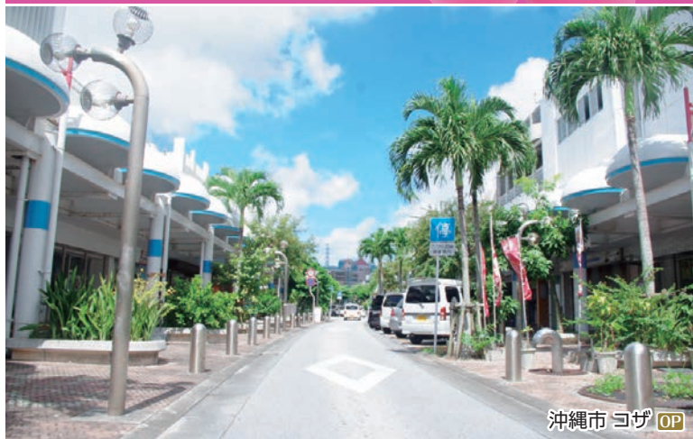
沖縄市 コザ OP

沖縄市は沖縄の伝統と異国情緒がミックスされた独特の文化「チャンプルー文化」発祥の地。「音楽の街」、沖縄伝統の「エイサーの街」また、2月の中旬からは、広島カープが春季キャンプを行うことでも知られています。