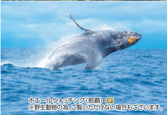
ホエールウォッチング(那覇) OP ※野生動物の為、ご覧いただけない場合もございます。