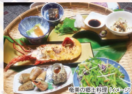
奄美の郷土料理(イメージ)