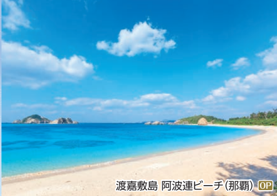
渡嘉敷島 阿波連ビーチ(那覇) OP