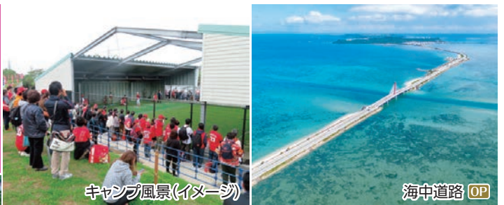
キャンプ風景(イメージ)