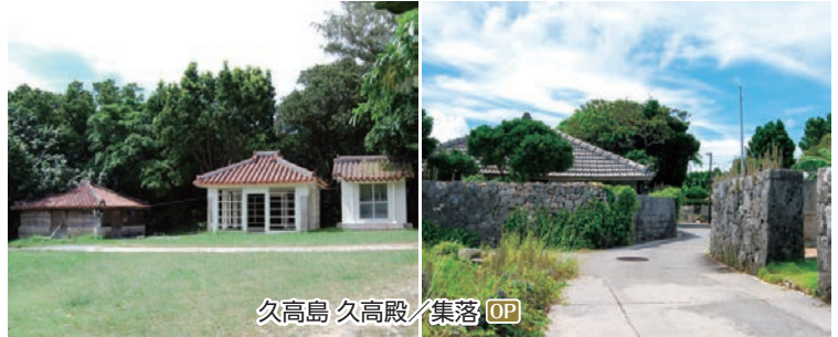
久高島 久高殿/集落 OP

OP ケラマブルーと呼ばれる世界有数の透明度を誇る海の渡嘉敷島や琉球の開闢の祖アマミキヨが降り立った地と言われ、琉球王朝の聖地としても知られる久高島へ。