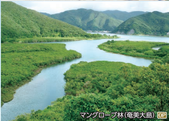
マングローブ林(奄美大島) OP