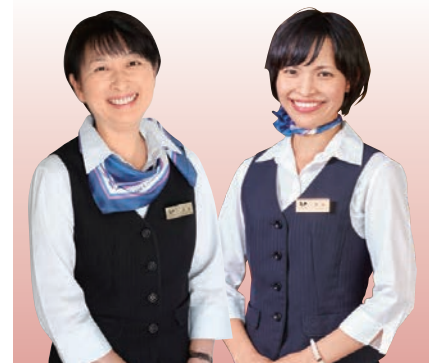
クルーズコーディネーター

船内生活のご相談は 船内7階クルーズデスクへ。 皆様の旅をお手伝い いたします。