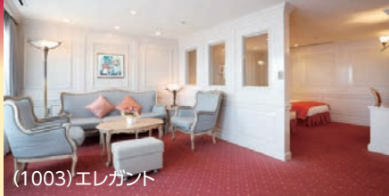
(1003)エレガント ロイヤルスイートルーム A(1001 1002)B(1003 1004)

定員2名(65㎡ 10階、展望バス・トイレ・バルコニー付) ※ブルーレイプレーヤー、Eメール・インターネット閲覧専用ノートパソコン付