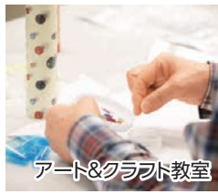
アート&クラフト教室