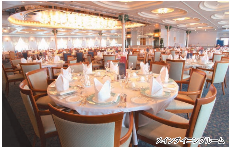
メインダイニングルーム