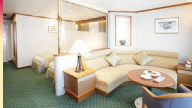
スイートルーム 定員2名 (35㎡ 10階、バス・トイレ・バルコニー付) ※ブルーレイプレーヤー付

定員2名(65㎡ 10階、展望バス・トイレ・バルコニー付) ※ブルーレイプレーヤー、Eメール・インターネット閲覧専用ノートパソコン付