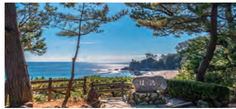
〇〇 高知 (高知県)

末の志士である坂本龍馬や中岡慎太郎ゆかりの地が点在するなど歴史スポットも多い高知県。多くを太平洋に面していることから「鯉のタタキ」「清水サバ」といった美味しい海の幸も楽しめます。