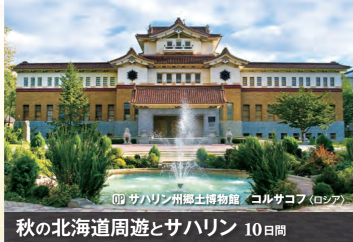
〇〇 サハリ州郷土博物館 コルサコフ (ロシア)

末の志士である坂本龍馬や中岡慎太郎ゆかりの地が点在するなど歴史スポットも多い高知県。多くを太平洋に面していることから「鯉のタタキ」「清水サバ」といった美味しい海の幸も楽しめます。