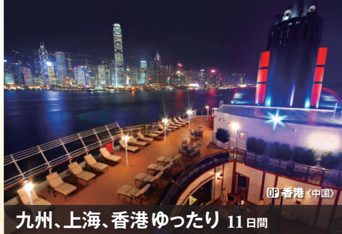
〇〇 香港 (中国)

加賀百万石の城下町として栄えたこの地には、今でも古くからの町家や寺社が数多く残っています。また日本三大名園のひとつ、兼六園も人気の観光地。五大醤油の産地に由来する和食の名店で食事をするのもオススメです。