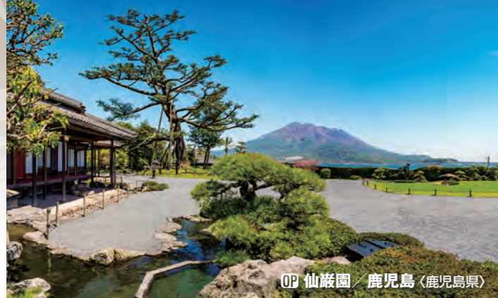
OP 仙巖園 / 鹿児島 (鹿児島県)