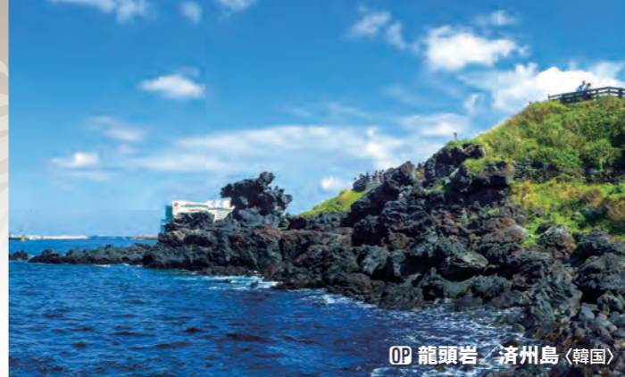
OP 龍頭岩 / 済州島 (韓国)

台湾の首都台北の魅力の一つはグルメ。あらゆる中華料理が揃っており、しかも一流の店が味と技を競い合っています。また、建物の1階の一部を歩道として使う「騎楼」と呼ばれる建築構造も特徴的です。