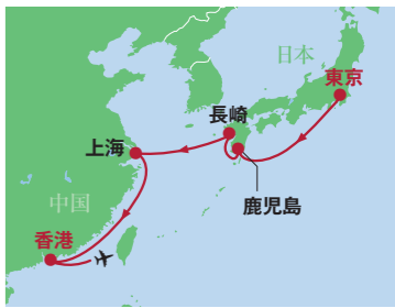
〇〇 上海 (中国)

中心部にある外灘は有名な海沿いの遊歩道で、対岸にある近未来的な街並みには上海タワーやピンクの球体部が特徴の東方明珠電視塔などがあります。