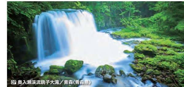
OP 奥入瀬溪流鏡子大滝 / 青森 (青森県)

【共通】 ※OP: オプションツアー(別料金)、パスポート有効残存期間: 下船時6ヶ月以上。機械読み取り式旅券が必要です。 ※外国籍の場合、査証が必要な場合がございます。査証取得など渡航に必要な手続きはお客様自身でお済ませいただきますようお願い申し上げます。 ※船内チップ・クルーズ代金に含まれています。但し、アルコール飲料、美容院、エステ等には15%のサービス料が加算されます。 ※国際観光旅客税(1,000円/大人・子供同額)が別途必要です。旅行代金とあわせてお支払いください。