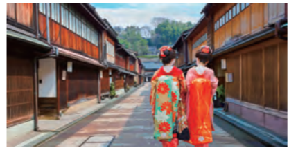
〇〇 金沢 (石川県)

加賀百万石の城下町として栄えたこの地には、今でも古くからの町家や寺社が数多く残っています。また日本三大名園のひとつ、兼六園も人気の観光地。五大醤油の産地に由来する和食の名店で食事をするのもオススメです。