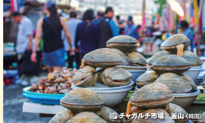
OP チャガルチ市場 / 釜山 (韓国)

新元号「令和」ゆかりの地として、注目を集める太宰府。「学問・至誠・厄除けの神様」として有名な、菅原道真が祀られている「太宰府天満宮」は、福岡観光で外せない人気スポットです。