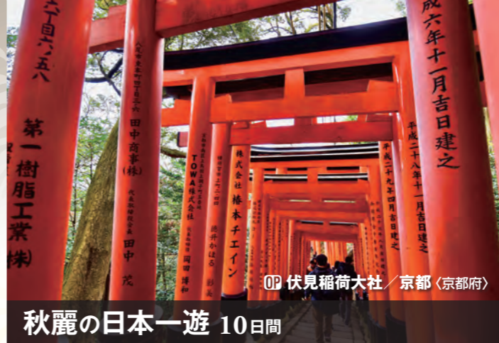
〇〇 伏見稲荷大社 / 京都 (京都府)

同キャビンタイプの中でも代金が異なるキャビンもご用意しています。また、これ以外の高級キャビンもご予約可能です。ご希望の場合はお問い合わせください。