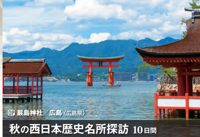
〇〇 厳島神社 / 広島 (広島県)