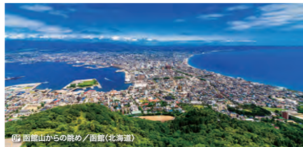
〇〇 函館山からの眺め / 函館(北海道)

【共通】 ※〇〇:オプションツアー(別料金)、パスポート有効残存期間:下船時6ヶ月以上。機械読み取り式旅券が必要です。 ※外国籍の場合、査証が必要な場合がございます。査証取得など渡航に必要な手続きはお客様自身でお済ませいただきますようお願い申し上げます。 ※船内チップ...クルーズ代金に含まれています。但し、アルコール飲料、美容院、エステ等には15%のサービス料が加算されます。 ※国際観光旅客税(1,000円/大人・子供同額)が別途必要です。旅行代金とあわせてお支払いください。