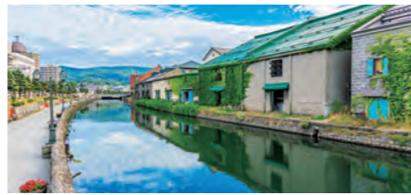
〇〇 小樽 (北海道)

小樽市は主にガラス工芸、オルゴール、酒蔵で知られています。小樽運河沿いにある1923年に造られた旧倉庫街は、現在ではカフェやショップが並ぶモダンな地区に生まれ変わっています。