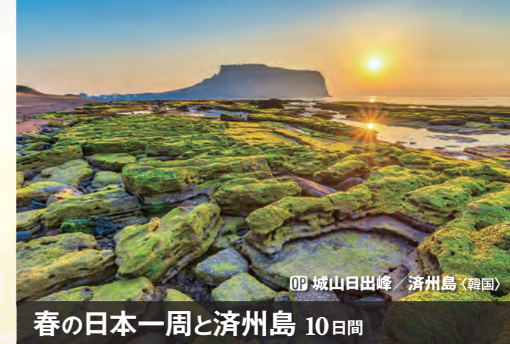
OP 城山日出峰 / 済州島 (韓国)

室戸岬は室戸阿南海岸国立公園に指定されている景勝地。太平洋につき出ている岩礁と岬をおおう亜熱帯性樹林が見事です。