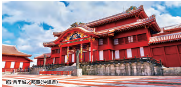
OP 首里城 / 那覇 (沖縄県)

【共通】 ※OP: オプションツアー(別料金)、パスポート有効残存期間: 下船時6ヶ月以上。機械読み取り式旅券が必要です。 ※外国籍の場合、査証が必要な場合がございます。査証取得など渡航に必要な手続きはお客様自身でお済ませいただきますようお願い申し上げます。 ※船内チップ・クルーズ代金に含まれています。但し、アルコール飲料、美容院、エステ等には15%のサービス料が加算されます。 ※国際観光旅客税(1,000円/大人・子供同額)が別途必要です。旅行代金とあわせてお支払いください。