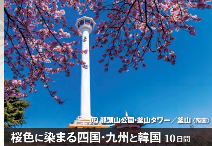
OP 龍頭山公園・釜山タワー / 釜山 (韓国)

お部屋カテゴリー毎に用意している専用レストランは20世紀前半の豪華客船の食堂を再現したような雰囲気のなかゆったりとお食事。そのほかにもスペシャリティ・レストラン、バーやラウンジでバラエティ豊かな美食をご堪能ください。