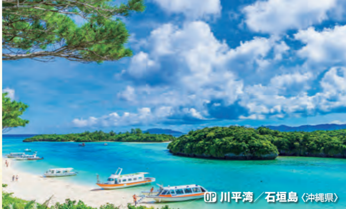
OP 川平湾 / 石垣島 (沖縄県)

長崎は坂が多い街で鎖国時代に出島が置かれ、オランダとの貿易により海で外国とつながっていました。唐人屋敷などに見られるように異国情緒があふれるところが魅力。被爆の地長崎には、平和活動のシンボルも多くあります。シーボルト邸跡、グラバー邸、大浦天主堂なども有名です。