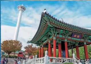
釜山タワー(イメージ)