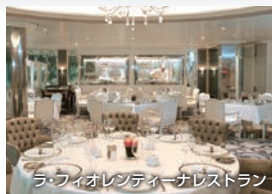
ラフィオレンティーナレストラン

日中はブッフェ、夜はレストランとなる。モノトーンのクラシックな店内に明るい光が差し込みます(無料)