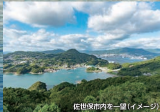
佐世保市内を一望(イメージ)