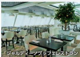
ジャルディーノブッフエレストラン

フルコース料理のランチとディナーはもちろん朝食もお楽しみいただけるメインダイニング(無料)