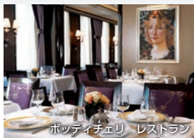
ポッティチェリ レストラン

フルコース料理のランチとディナーはもちろん朝食もお楽しみいただけるメインダイニング(無料)