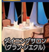
ダイニングサロン (グランジエクル)