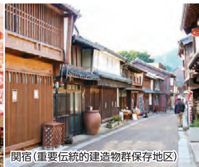
関宿 (重要伝統的建造物群保存地区)