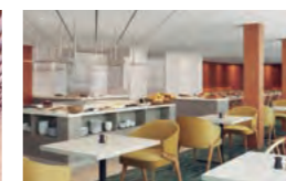
「リドカフェ&リドガーデン」も新しく。