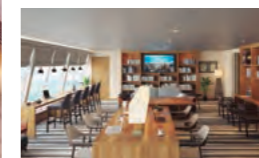
ブックラウンジ「イー・スクエア」。