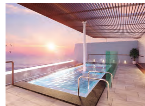
潮風と絶景とともにバスタイムを楽しむ「グランドスパ 露天風呂」。

2020年春のリニューアル後、初となるグランドクルーズ。終日航海日の多いゆとりあるオセアニアグランドクルーズでは、船内の新しい魅力をより深く感じていただけます。