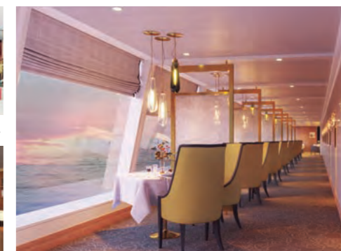
Sロイヤルスイート・Aアスカスイートのお客様専用のプレミアムダイニング「ザ・ベール」。

※画像は完成予想のイメージCGです。改装情報につきましては2020年1月時点のものであり、内容及びイメージは変更・中止となることがございます。※露天風呂は停泊時および航路上の都合や天候、運用上等の理由により営業時間が限られます。