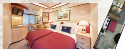
プリンセススイート ■約31㎡ ■バスタブ・バルコニー付