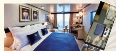
海側バルコニー ■約21㎡ ■シャワー・バルコニー付