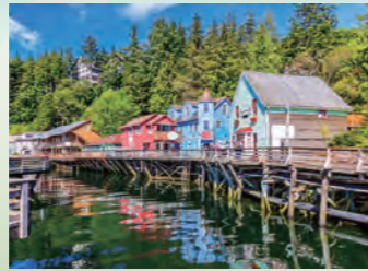
ケチカン (アラスカ州 / 米国)

スワード山の麓に広がる広さ24万ヘクタールの氷河で覆われたクナイ・フィヨルド国立公園はアラスカでも人気の観光スポットです。