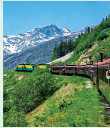
スキャグウェイ (アラスカ州 / 米国)

アラスカ最南端の街・ケチカン。クリンキットインディアンの故郷であるこの地には多くのトーテムポールがあり、ネイティブ・アメリカンの文化遺産が数多く残っています。