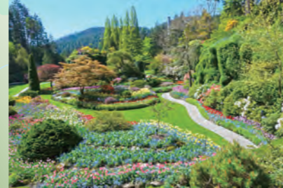
ブッチャート・ガーデン ビクトリア (カナダ)

毎年100万人近くの観光客が訪れるビクトリアを代表する観光地と言えば、ブッチャート・ガーデン。「花の街ビクトリア」を象徴する広大な庭園です。