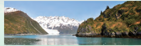
クナイ・フィヨルド国立公園 / アンカレッジ (アラスカ州 / 米国)

スワード山の麓に広がる広さ24万ヘクタールの氷河で覆われたクナイ・フィヨルド国立公園はアラスカでも人気の観光スポットです。