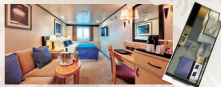
海側 ■約17㎡ ■窓・シャワー付