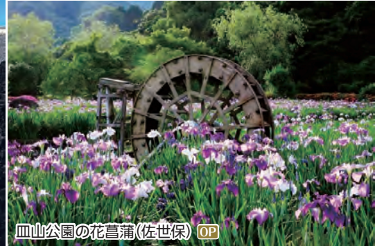
皿山公園の花菖蒲(佐世保) OP