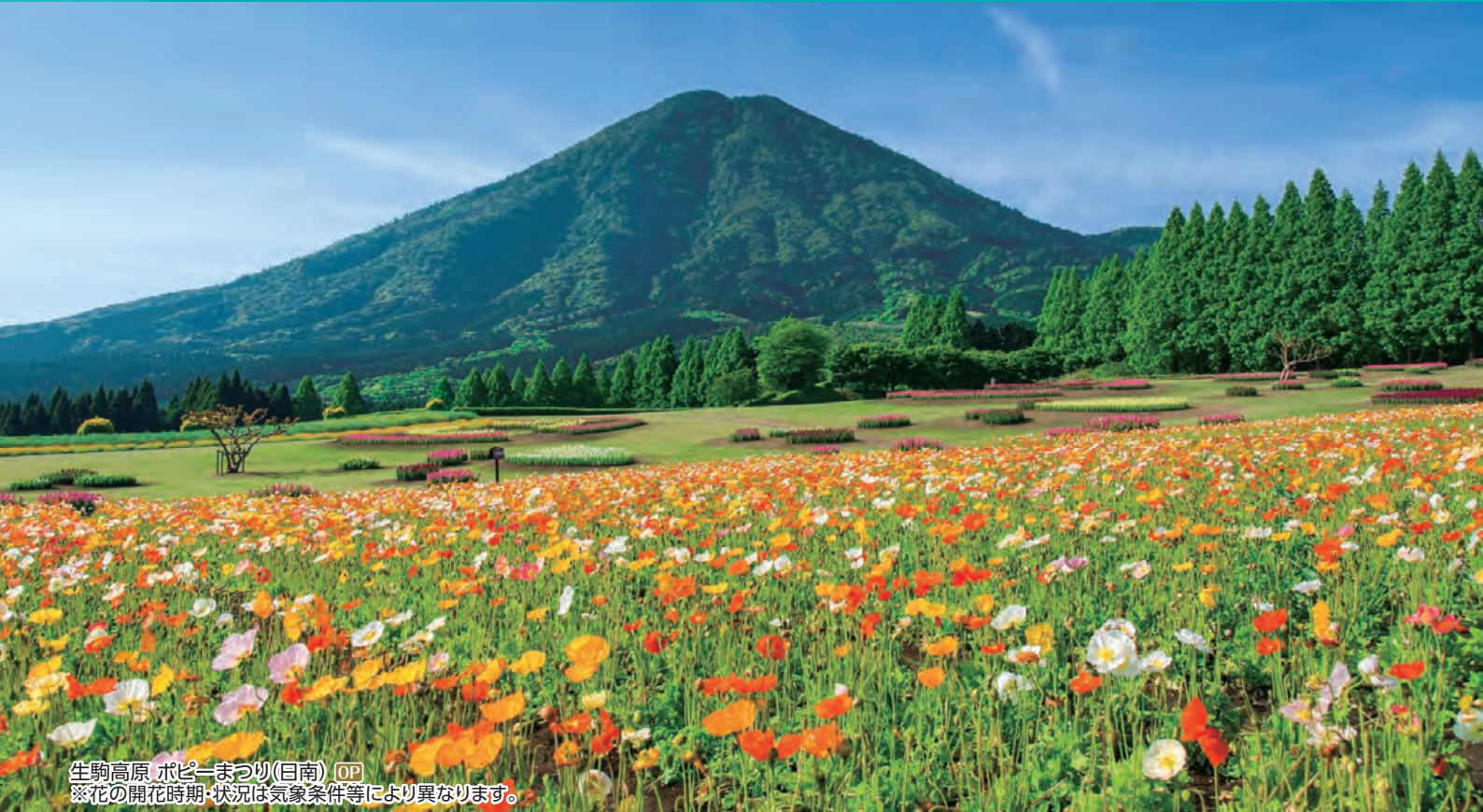
生駒高原 ポピーまつり(日南) OP ※花の開花時期・状況は気象条件等により異なります。