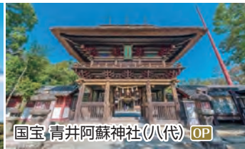
国宝 青井阿蘇神社(八代) OP