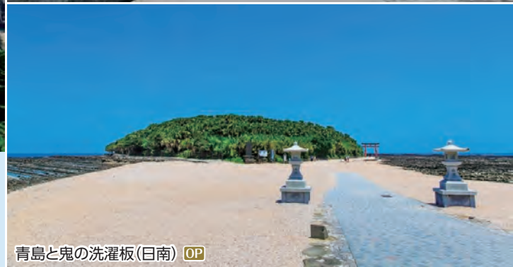
青島と鬼の洗濯板(日南) OP