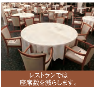
レストランでは座席数を減らします。