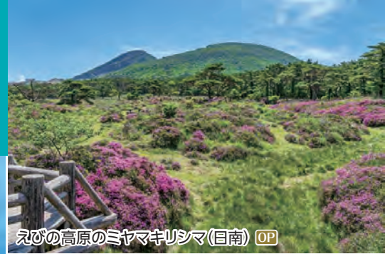
えびの高原のミヤマキリシマ(目南) OP