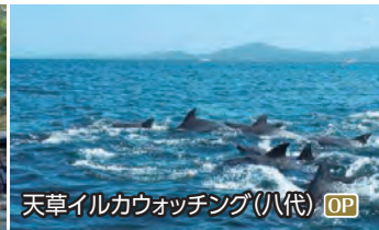
天草イルカウォッチング(八代) OP