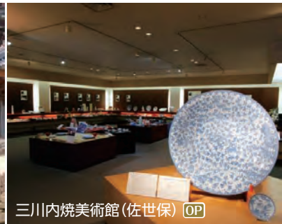
三川内焼美術館(佐世保) OP