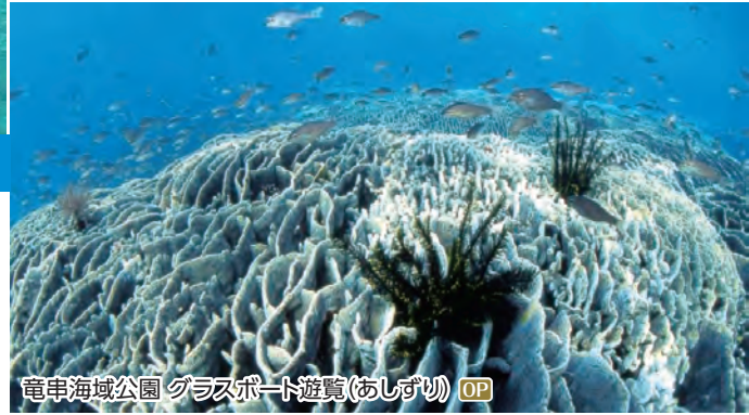
竜串海域公園 グラスボート遊覧(あしずり) OP