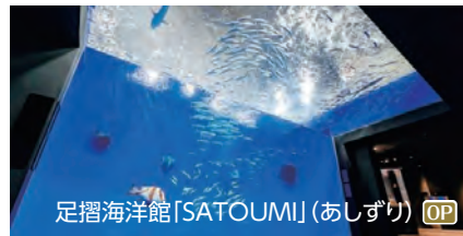
足摺海洋館「SATOUMI」(あしずり) OP