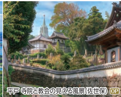
平戸 寺院と教会の見える風景(佐世保) OP