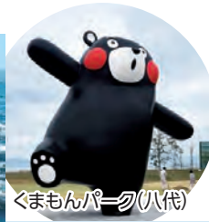
くまもんパーク(八代)