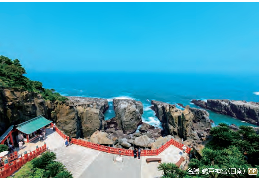
名勝 鶏戸神社(日南) OP

足摺岬・金剛福寺、四万十川遊覧、佐田沈下橋 ◆所要時間:約7.5時間 ◆お食事:昼食付