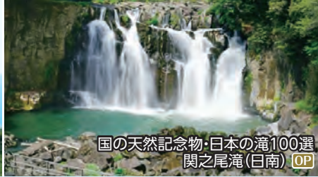
国の天然記念物・日本の滝100選 関之尾滝(日南) OP