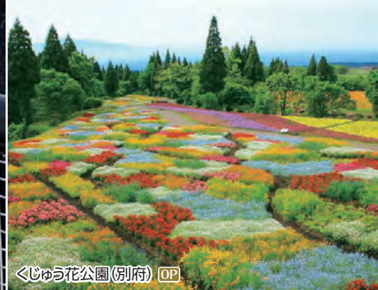
くじゅう花公園(別府) OP