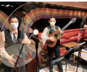
感染症対策(一例) メインホール・メインラウンジは席の間隔をあけてお座りいただけます。