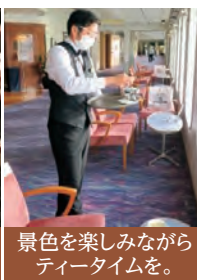
景色を楽しみながらティータイムを。