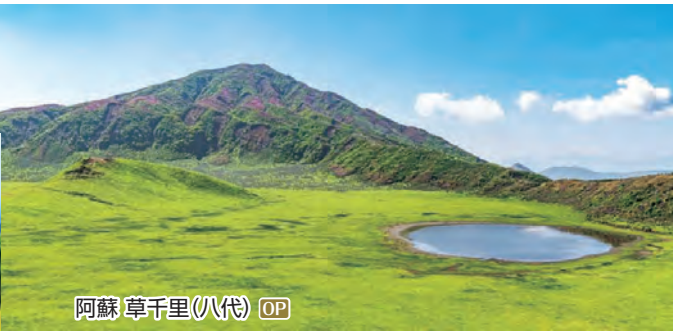
阿蘇 草千里(八代) OP