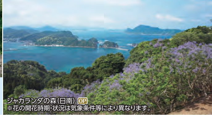
ジャカラダの森(日南) OP