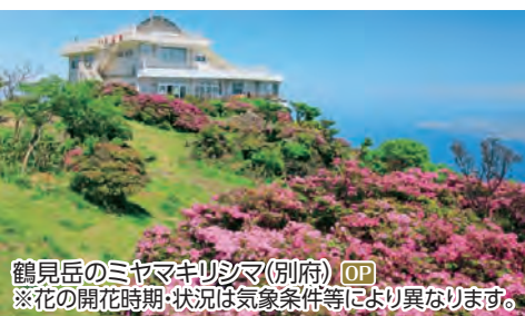
鶴見岳のミヤマキリシマ(別府) OP