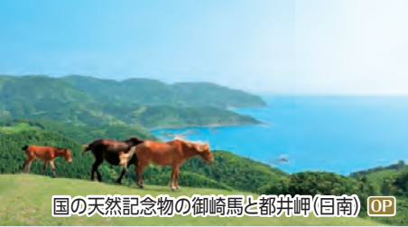
国の天然記念物の御崎馬と都井岬(日南) OP