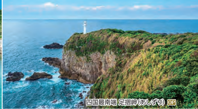
四国最南端 足摺岬(あしずり) OP