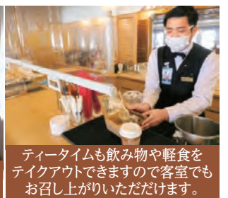
ティータイムも飲み物や軽食をテイクアウトできますので客室でもお召し上がりいただけます。