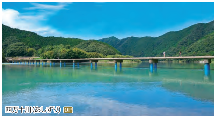
四万十川(あしずり) OP