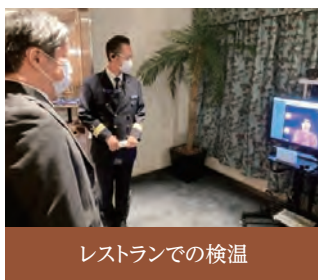
レストランでの検温

変わらない美味しさにより安心と安全を添えてお食事・ティータイムなどビュッフェを取り止め、スタッフが取り分けてご提供します。