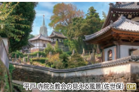
平戸寺院と教会の見える風景(佐世保) OP