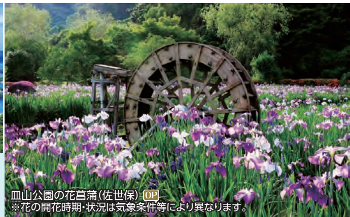
血山公園の花菖蒲(佐世保) OP