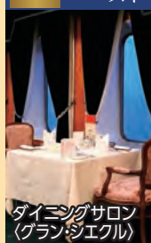
ダイニングサロン (グランシエクル)