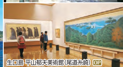
生口島 平山郁夫美術館(尾道糸崎) OP