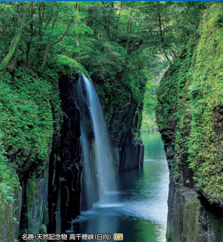
名勝・天然記念物 高千穂峽(日向) OP