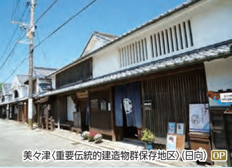
美々津<重要伝統的建造物群保存地区>(日向) OP