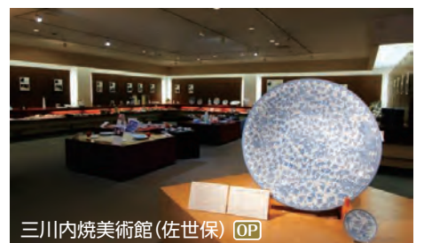
三川内焼美術館(佐世保) OP