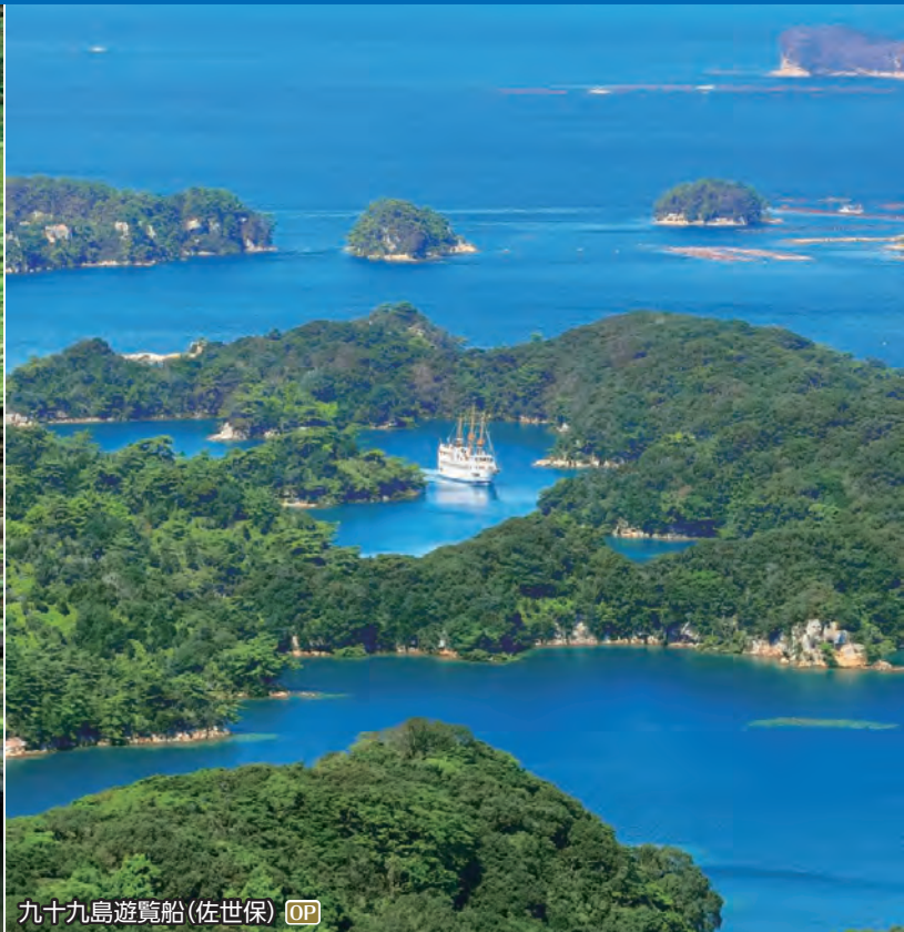
九十九島遊覧船(佐世保) OP