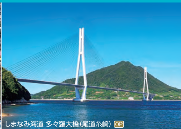
しまなみ海道 多々羅大橋(尾道糸崎) OP