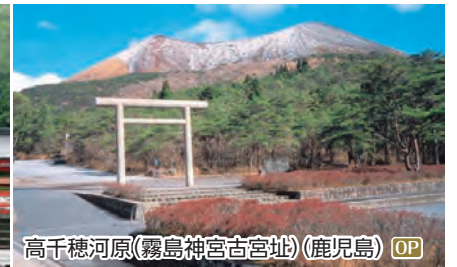
高千穂河原(霧島神宮古宮址)(鹿児島) OP