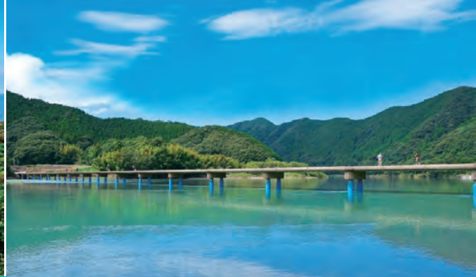
四万十川(あしずり) OP