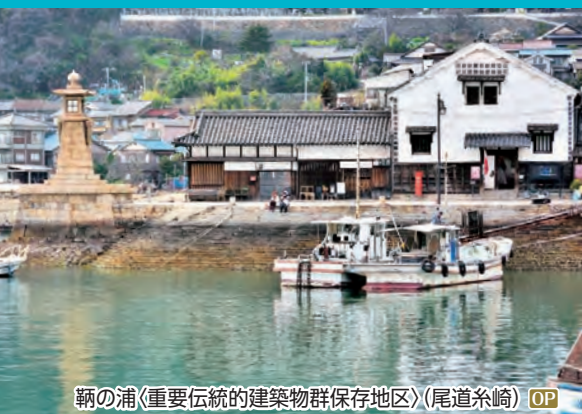
鞆の浦(重要伝統的建築物群保存地区)(尾道糸崎) OP