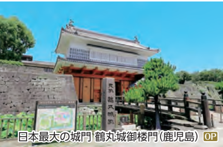
日本最大の城門 鶴丸城御楼門(鹿児島) OP