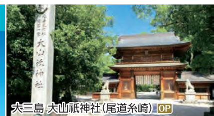
大三島 大山祇神社(尾道糸崎) OP