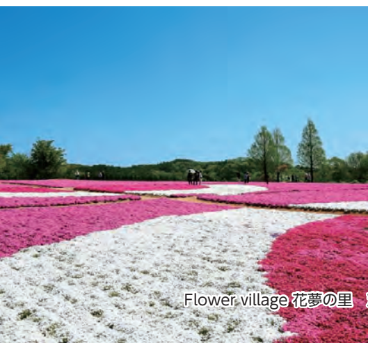
Flower village 花夢の里