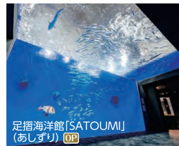
足摺海洋館「SATOUMI」 (あしずり) OP