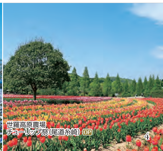
世羅高原農場 チューリップ祭(尾道糸崎) OP