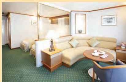
スイート A(1005~1018) B(1019 1020)

定員2名(35㎡ 10階、バストイレ・バルコニー付) ※ブルーレイプレーヤー付 ※スイートBは、救命ポートによりベランダの眺望が妨げられます。