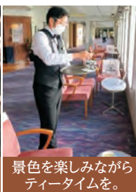
景色を楽しみながらティータイムを。