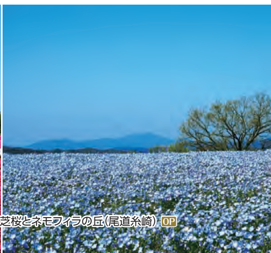
芝桜とネモフィラの丘(尾道糸崎) OP