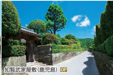
知覧武家屋敷(鹿児島) OP