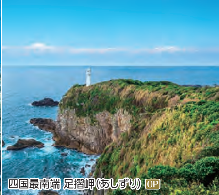
四国最南端 足摺岬(あしずり) OP