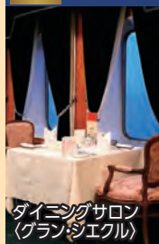
ダイニングサロン (グランシエール)

◆専用ダイニングで専属シェフによる特別なメニューときめ細やかなサービスでおもてなし。二人掛けテーブルでゆったりとお食事をお楽しみいただけます。 ※ダイニングサロンは未就学児童の方はご利用いただけません。 ※感染症対策の為、お客様の人数によっては食事時間が交代制になる場合がございます。 ◆乗船日にはお部屋にウェルカムスイーツをお届けします。