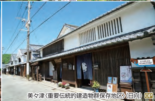
美々津(重要伝統的建造物群保存地区)(日向) OP