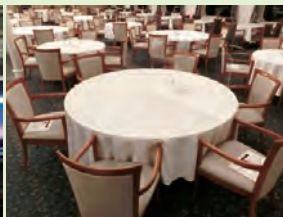
レストランでは座席数を減らします。