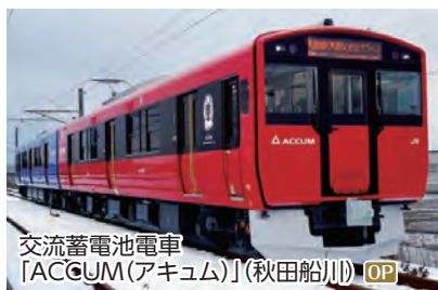
交流蓄電池電車「ACCUM(アキユム)」(秋田船川) OP

寒風山、小玉家住宅特別見学・小玉醸造見学、男鹿線ローカル列車乗車(上二田～男鹿駅) ◆所要時間:約6.5時間 ◆お食事:昼食付