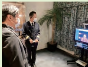
レストランでの検温