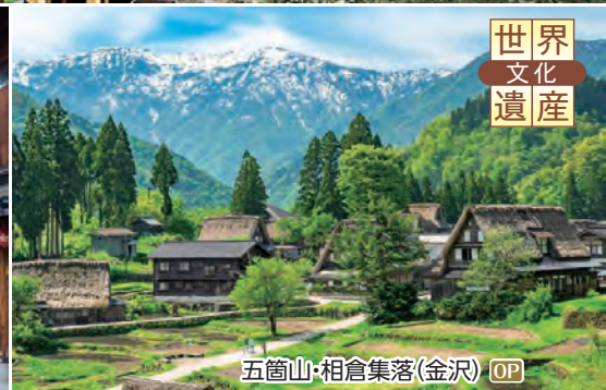
五箇山・相倉集落(金沢) OP