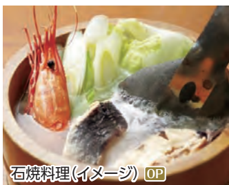
石焼料理(イメージ) OP

寒風山、なまはげ館、真山神社、雲昌寺、入道崎 ◆所要時間:約7時間 ◆お食事:石焼料理の昼食付