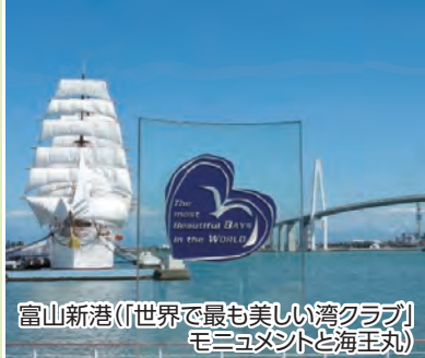
富山新港(「世界で最も美しい湾クラブ」モニュメントと海王丸)

海越しに見える雄大な立山連峰の景観が素晴らしく「世界で最も美しい湾クラブ」にも加盟しています。シロエビを初め豊かな海の幸にも恵まれています。