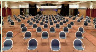
メインホール・メインラウンジは席の間隔をあけてお座りいただけます。