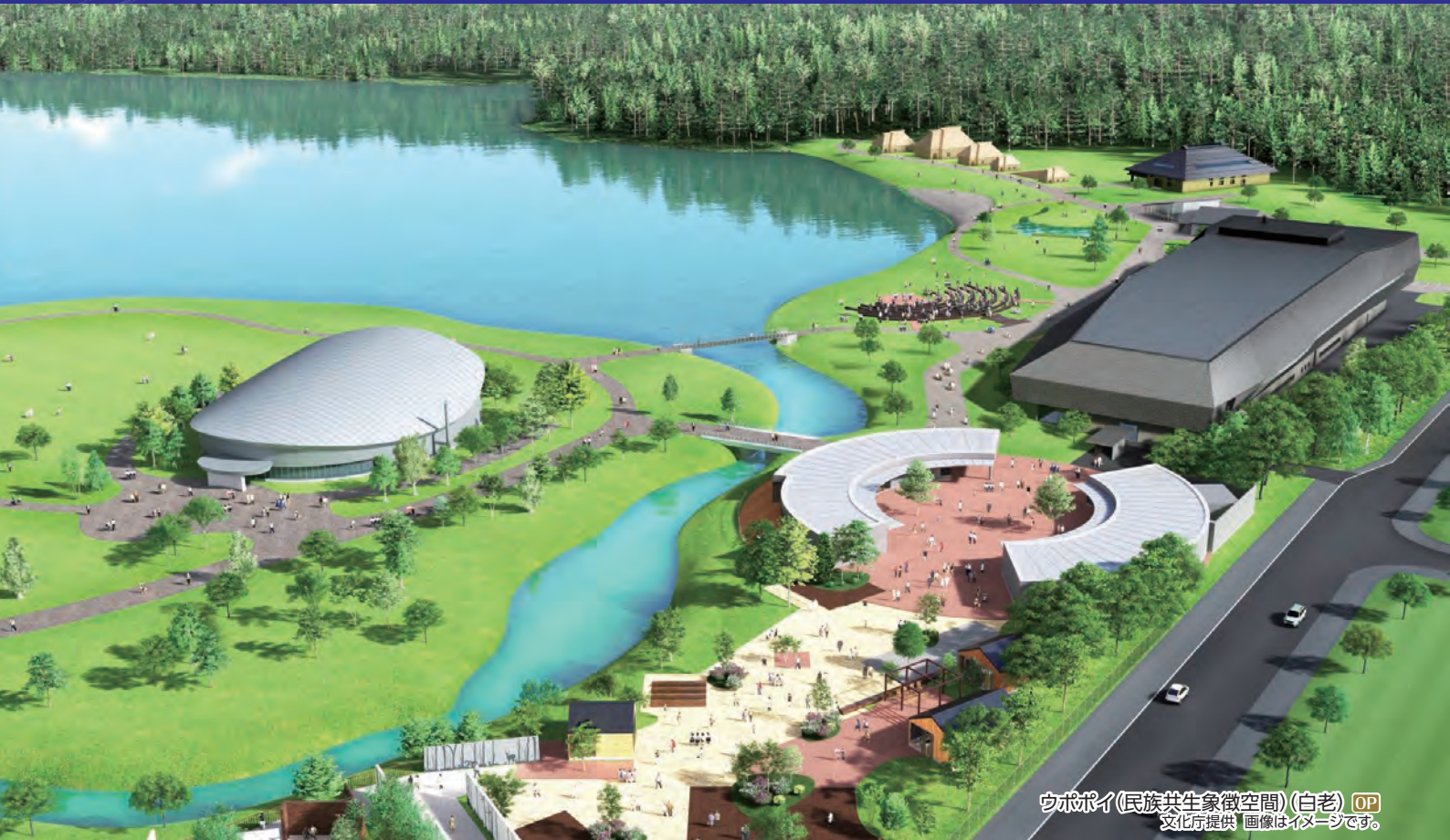
ウポポイ(民族共生象徴空間)(白老) OP 画像はイメージです。