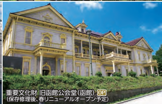
重要文化財 旧函館公会堂(函館) OP (保存修理後、春リニューアルオープン予定)