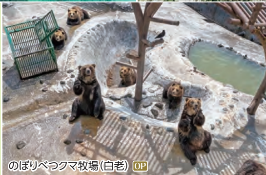
のぼりべつクマ牧場(白老) OP

太平洋側に面した町で、海・山・森林など豊かな自然に恵まれています。この地には昔からアイヌ民族の集落があり、アイヌ民族の歴史と文化を感じられる町です。