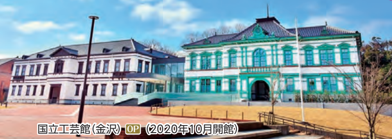
国立工芸館(金沢) OP (2020年10月開館)