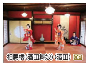
相馬楼(酒田舞娘)(酒田) OP