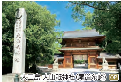
大三島 大山祇神社(尾道糸崎) OP