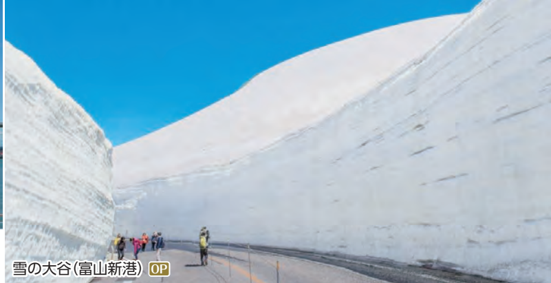
雪の大谷(富山新港) OP