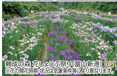
頼成の森花しょうぶ祭り(富山新港) OP ※花の開花時期:状況は気象条件等により異なります。