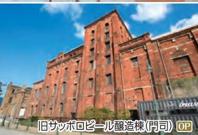
旧サッポロビール醸造棟(門司) OP