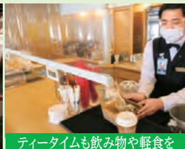
ティータイムも飲み物や軽食をテイクアウトできますので客室でもお召上がりいただけます。