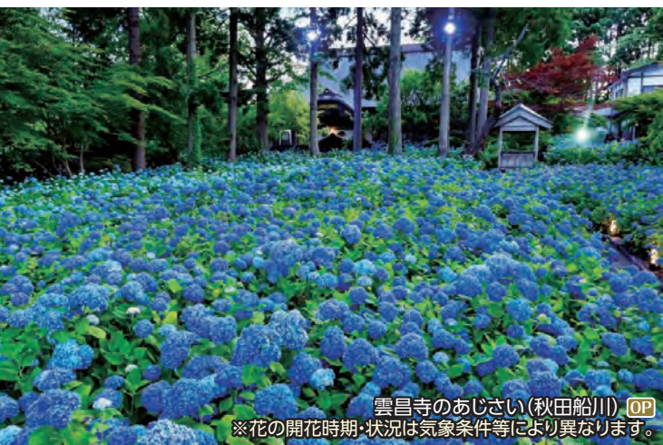
雲昌寺のあじさい(秋田船川) OP ※花の開花時期・状況は気象条件等により異なります。

白老八幡神社、仙台藩白老陣屋跡、ウポイ(国立アイヌ民族博物館・伝統芸能鑑賞) ◆所要時間:約7.5時間 ◆お食事:昼食付