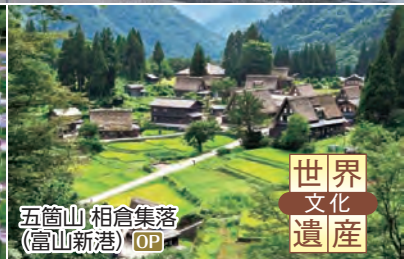
五箇山 相倉集落(富山新港) OP