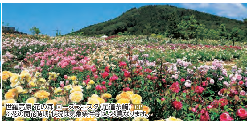
世羅高原 花の森「ローズフェスタ」(尾道糸崎) OP ※花の開花時期:状況は気象条件等により異なります。