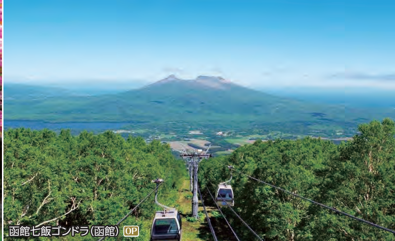
函館七飯 Gondola(函館) OP