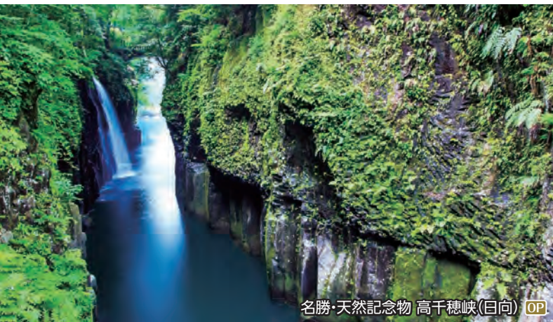
名勝・天然記念物 高千穂峽(日向) OP