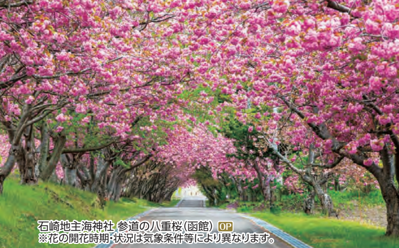
石崎地主海神社 参道の八重桜(函館) OP ※花の開花時期・状況は気象条件等により異なります。