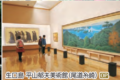
生口島 平山郁夫美術館(尾道糸崎) OP