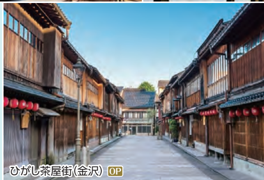
ひがし茶屋街(金沢) OP

加賀百万石の城下町の歴史を今に伝える史跡が多く残されており、昔日の風情を感じられます。新しい観光スポットも出来、さらに魅力を増しています。