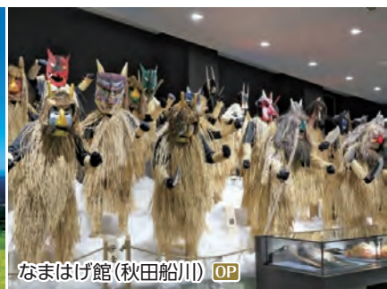
なまはげ館(秋田船川) OP