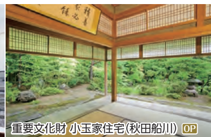
重要文化財 小玉家住宅(秋田船川) OP