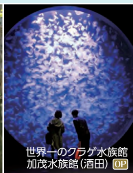
世界一のクラゲ水族館 加茂水族館(酒田) OP