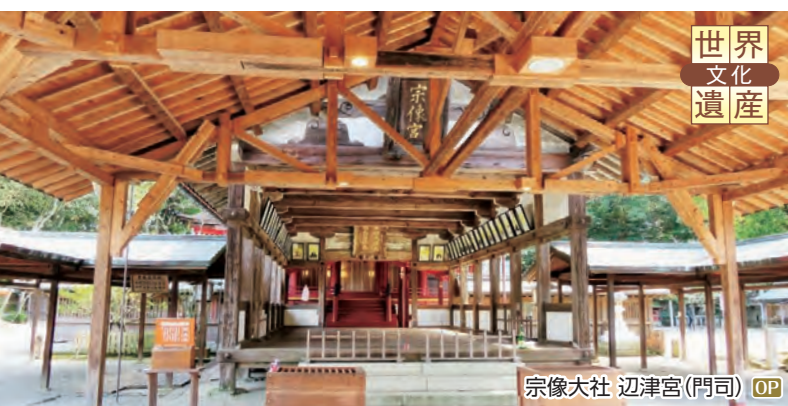
宗像大社 辺津宮(門司) OP