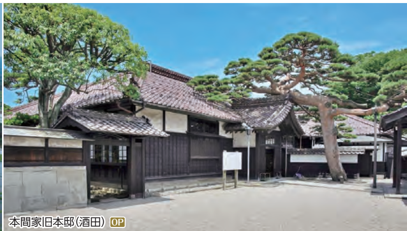
本間家旧本邸(酒田) OP