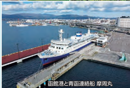
函館港と青函連絡船 摩周丸

建ち並ぶ教会や洋館、坂が織りなす異国情緒漂う街並み、幕末の歴史に翻弄された史跡をはじめ、旬の味覚が楽しめる朝市など多彩な魅力にあふれています。