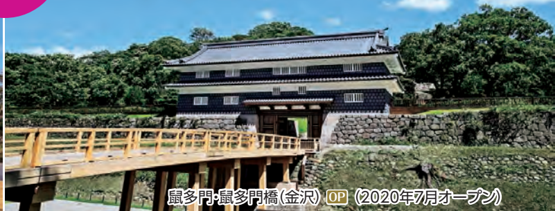
鼠多門・鼠多門橋(金沢) OP (2020年7月オープン)