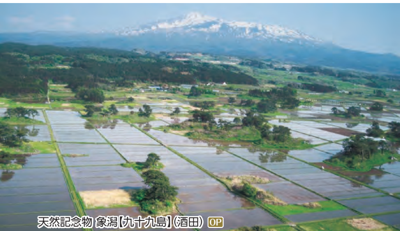
天然記念物 象潟【九十九島】(酒田) OP