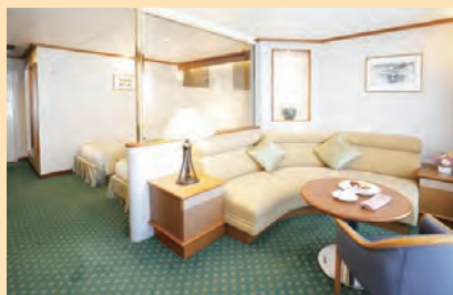
スイート A(1005~1018) B(1019 1020)

定員2名(35㎡ 10階、バス・トイレ・バルコニー付) ※ブルーレイプレーヤー付 ※スイートBは、救命ボートによりベランダの眺望が妨げられます。