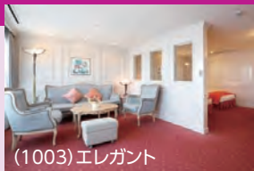
(1003)エレガント 定員2名(65㎡ 10階、展望/バス・トイレ・バルコニー付) ※ブルーレイプレーヤー、インターネット閲覧専用ノートパソコン付