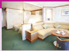
定員2名(35㎡ 10階、バス・トイレ・バルコニー付) ※ブルーレイプレーヤー付 ※スイートBは、救命ボートによりベランダの眺望が妨げられます。