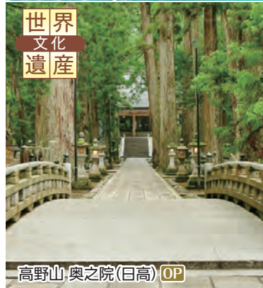
高野山・奥之院(日高) OP