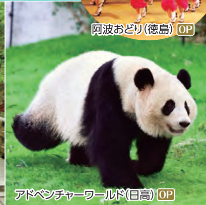
アドベンチャーワールド(日高) OP