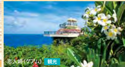
恋人岬 (グアム) 観光

風光明媚な海沿いのドライブがおすすめのグアム、サイパン。ブリスベンから訪れるゴールドコーストでは美しい砂浜のビーチへどうぞ。仏領ニューカレドニアのヌーメアでは洗練されたリゾートの雰囲気を楽しめます。