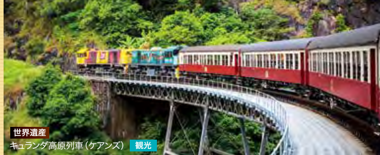
世界遺産 キュランダ高原列車(ケアンズ) 観光

●クルーズ下船日に有効期限が6ヵ月以上残っている旅券(パスポート)が必要です。●サイパン、グアムではESTA(電子渡航認証システム)による認証取得または査証(ビザ)が必要です。査証は米国査証免除プログラムの非適格条項に該当する場合には必要です。オーストラリアではETAS(電子渡航許可)または査証(ビザ)が必要です。ニュージーランドではNZeTA(電子渡航認証)または査証(ビザ)が必要です。●各国、新型コロナウイルス感染症の感染状況によっては、入国制限がある場合がございます。