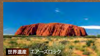
世界遺産 エアーズロック