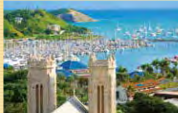
※写真はヌーメアのイメージです。この写真を撮影したFOLの丘は2021年9月現在休業しています。