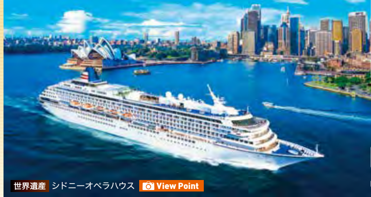
世界遺産 シドニーオペラハウス View Point

多様な文化を受け入れるシドニー、世界最古の熱帯雨林を堪能できるケアンズ、緑豊かなオークランドなど、都市でありながらも大自然に寄り添う、表情豊かな街を訪れます。