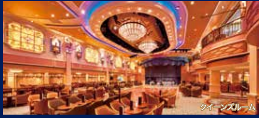
クイーンズルーム

英国女王エリザベス2世に命名されたクイーン・エリザベス。現在の「クイーン・エリザベス」は、2010年に就航した3代目。船内には名付け親でもあるエリザベス女王の肖像画が飾られ、英国の伝統を受け継ぐ上品な雰囲気包まれています。2018年の改装で客室やスパなどが一新されました。