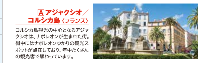
A アジャクシオ/コルシカ島(フランス) コルシカ島観光の中心となるアジャクシオは、ナポレオンが生まれた街。街中にはナポレオンゆかりの観光スポットが点在しており、年中たくさんの観光客で賑わっています。