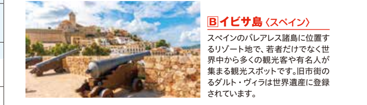
B イビサ島(スペイン) スペインのパレアレス諸島に位置するリゾート地で、若者だけでなく世界中から多くの観光客や有名人が集まる観光スポットです。旧市街のダルト・ヴィラは世界遺産に登録されています。