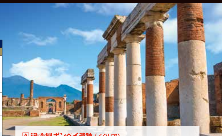
A 世界遺産 ポンペイ遺跡(イタリア) 一夜にして火山の噴火により消えた古代都市ポンペイ。18世紀ごろに発掘され、古代ローマの市民の生活を紐解く重要な巨大遺跡として知られています。