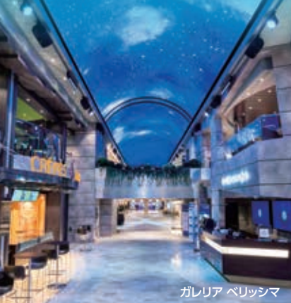
ガレリア ベリッシマ

すべての年代が楽しめる船内での様々なアクティビティや各年代のお子様に合わせてキッズクラブ、大人専用のラウンジや100種類以上の料理を楽しめる20時間営業のビュッフェなど、今までにない快適でエキサイティングなクルーズ旅行を提供します。