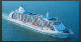
セブンスーズ ボイジャー SEVEN SEAS VOYAGER

2016年に大規模な改装を実施し、エレガントな装いへとリフレッシュ。客室を含む内装やレストランもリニューアルされました。客室はもともと小さいタイプでもバルコニーをのぞいて28mという広さがあります。