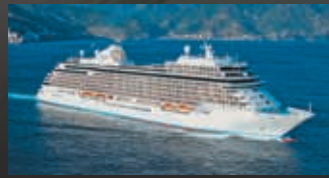
セブンスーズ エクスプローラー SEVEN SEAS EXPLORER

セブンスーズ エクスプローラーは、パブロ・ピカソの作品が壁面を飾り、エレガントなレストラン「コンパソーズ」の天井を鮮やかなコバルトブルーのガラス作品が彩るなど、目を見張るような内装が施されています。