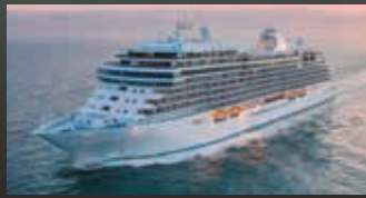
セブンスーズ スプレンドー SEVEN SEAS SPLENDOR

2020年にデビューしたセブンスーズ スプレンドーは、セブンスーズ エクスプローラーと同一タイプの最新の設備を備えており、オリジナルのミュージカルショーはプロドウェイの振付・脚本・演出チームにより、多彩なジャンルをご用意。