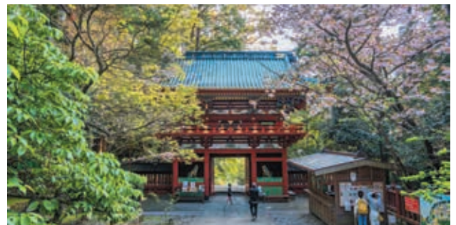
久能山東照宮 / 清水 (静岡県)

日本三景のひとつ芸芸の宮島。そのシンボルともいえる厳島神社の世界的にも珍しい海上に建つ建造物群と背後の自然が一体となった景観は、世界文化遺産に登録されています。歴史的にも文化的にも価値が高く、世界中から観光客が絶えない国宝建造物です。