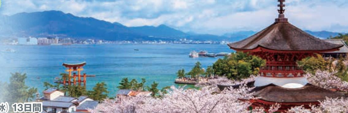
世界遺産 宮島 / 広島 (広島県)

日本三景のひとつ芸芸の宮島。そのシンボルともいえる厳島神社の世界的にも珍しい海上に建つ建造物群と背後の自然が一体となった景観は、世界文化遺産に登録されています。歴史的にも文化的にも価値が高く、世界中から観光客が絶えない国宝建造物です。