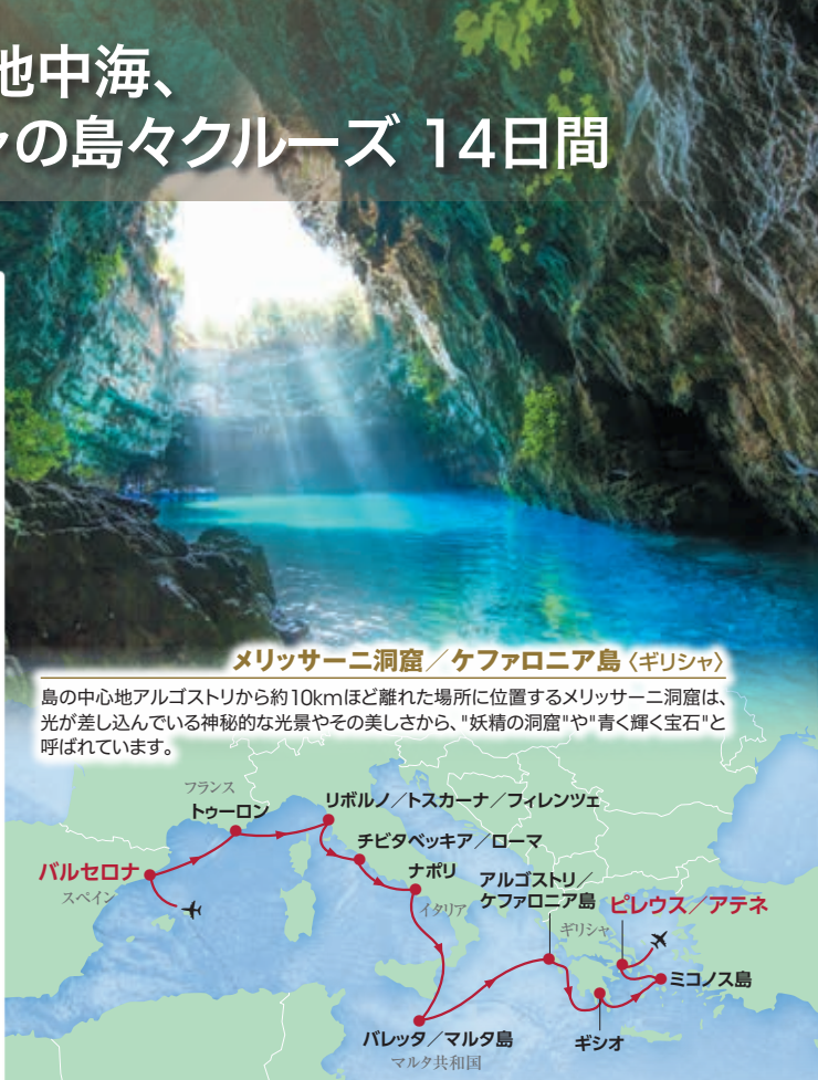
メリッサ二洞窟/ケファロニア島(ギリシャ)

島の中心地アルゴストリから約10kmほど離れた場所に位置するメリッサ二洞窟は、光が差し込んでいる神秘的な光景やその美しさから、「妖精の洞窟」や「青く輝く宝石」と呼ばれています。