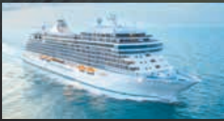
セブンスーズ グランデュアー SEVEN SEAS GRANDEUR

2023年11月デビューのラグジュアリークルーズ集大成とも言える客船。無料スペシャリティレストラン5つを含むダイニング8カ所で、130種類の新たなメニューをご提供。船内には1,600点のアートコレクションも展示しています。