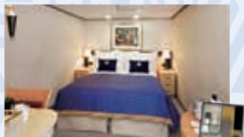
スタンダード内側