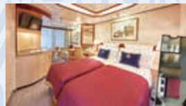
プリンセススイート