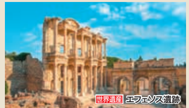
世界遺産 エフェソス遺跡