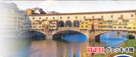
世界遺産 ヴェッキオ橋

街全体が世界遺産に登録されているフィレンツェ。ひときわ目を引くサンタ・マリア・デル・フィオーレ大聖堂や、ポッティチェリ、ダ・ヴィンチやミケランジェロなど数々の名画が並ぶウフィツィ美術館、フィレンツェ最古の橋として知られるヴェッキオ橋など、見どころは尽きません。