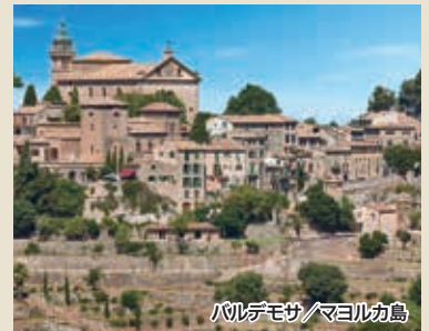
バルデモサ/マヨルカ島