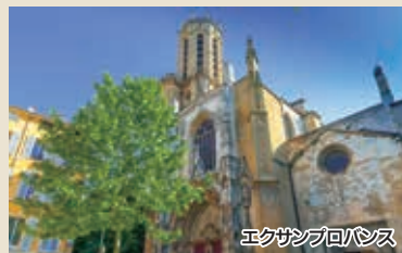
エクサンプロバンス