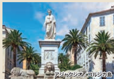
アジャクシオ/コルシカ島