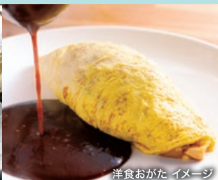
洋食おがた イメージ