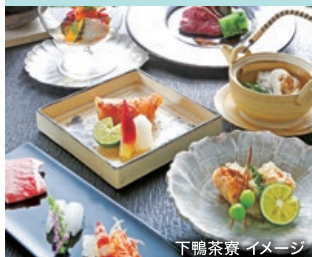
下鴨茶寮 イメージ

小山薫堂が主人を務め、京都で創業170年を数える老舗料亭「下鴨茶寮」と、同じく京都の洋食割烹「洋食おがた」。こだわりと新たな視点で生まれる一皿にご期待ください。